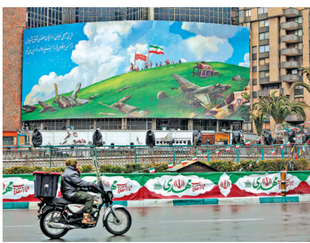
◀美伊關係高度緊張，圖為德黑蘭街頭的反美海報。