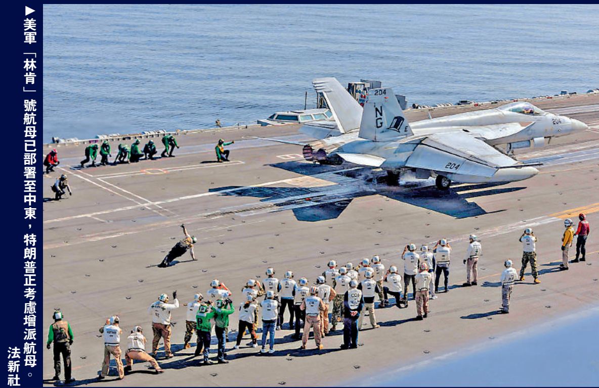
►美軍「林肯」號航母已部署至中東，特朗普正考慮增派航母。