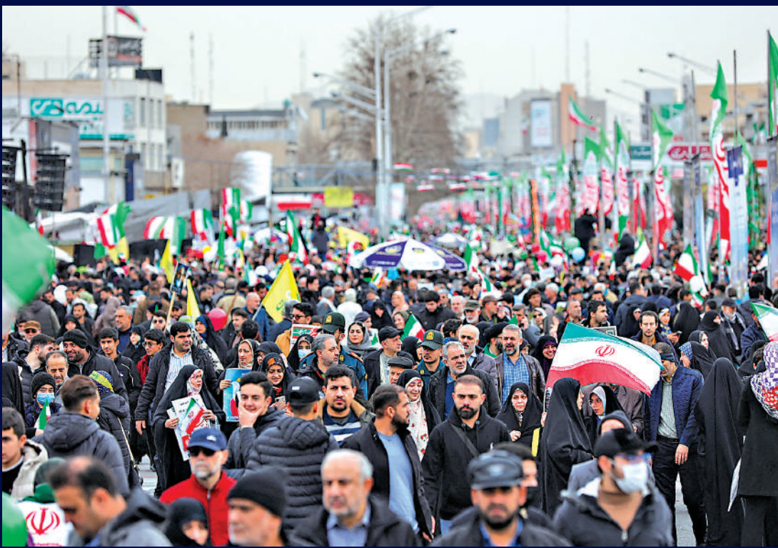
◀伊朗民眾11日舉行集會，慶祝伊朗伊斯蘭革命勝利47周年，抗議美國干預伊朗局勢。

美國總統特朗普10日威脅稱，他正在考慮向中東派遣第二個航母戰鬥群，以準備在與伊朗談判失敗時採取軍事行動。他聲稱，任何協議都必須涵蓋伊朗的核計劃和彈道導彈庫存。伊朗當局11日表示，伊朗不尋求核武器，但不會在「過度要求」面前退讓；導彈能力並不在與美國談判的範圍內。衛星圖像顯示，美軍已將部署在卡塔爾的「愛國者」導彈裝載到移動發射車上。伊朗外長阿拉格齊表示，伊朗已做好戰爭與外交「兩手準備」。