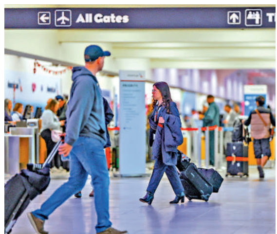
▲埃爾帕索國際機場11日恢復正常運作。

埃斯科瓦爾稱，墨西哥無人機進入美國「並非新鮮事」，不能解釋FAA為何突然關閉空域。她還說，新墨西哥州南部的空域限制尚未解除。另據消息人士稱，此次關閉空域與埃爾帕索國際機場附近的美軍布利斯堡基地「測試反無人機技術」有關。