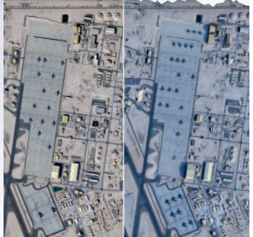
▲對比今年1月（左）和2月的衛星圖像，可見美軍部署在烏代德基地的飛機增多。