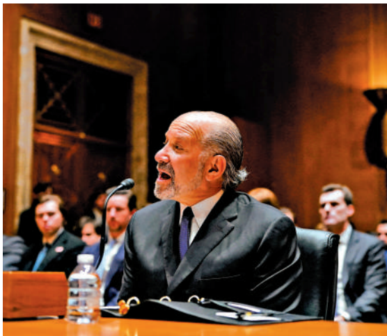
▲盧特尼克10日在國會聽證會上承認自己曾登上愛潑斯坦私人島嶼。

為「自殺」，但有傳言稱他實際上是被「滅口」。英媒9日稱，美國司法部公布的愛潑斯坦文件中包含他被發現死亡時的監控畫面，可見多名獄警在值守台與愛潑斯坦所在牢房之間往返穿梭。