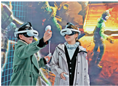
▲參觀者在北京首鋼國際會展中心體驗沉浸式科幻展。

「這三個圈層在空間上不是簡單的同心環的分布，而是嵌套的實心圓。意思就是，功能圈包含並大於通勤圈，產業協同圈在此基礎上進一步拓展。」夏林茂說。