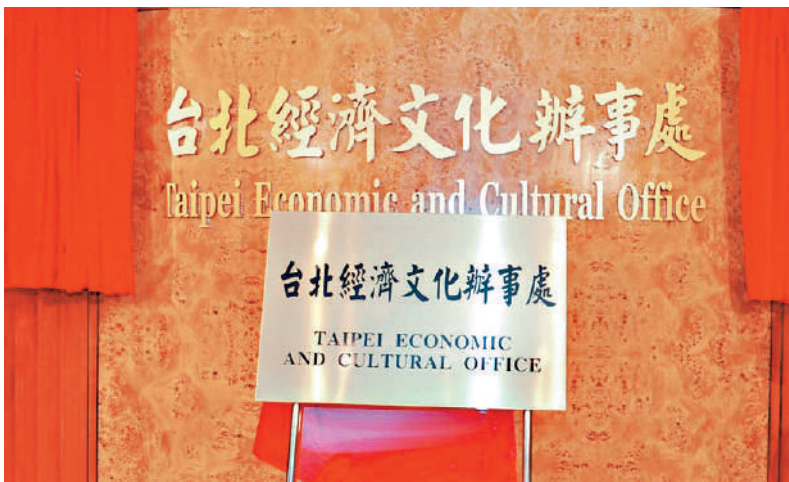
▲台灣是中國領土一部分，所以在其他地方的辦事處一般都是以「台北」為名。圖為2025年停止運作前的香港「台北經濟文化辦事處」。

【大公報訊】綜合中通社及台媒報道：魯吉尼埃內當地時間11日接受訪問時直言：「我看不出為什麼不能叫『台北代表處』」，並稱以「台北」名義設立「代表處」是歐盟國家設立台當局代表機構的普遍做法。