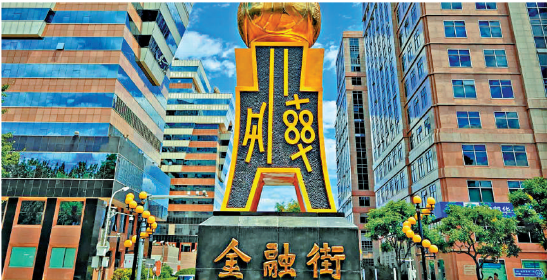
▲美國國會妄圖以金融手段「阻嚇」中國大陸推進兩岸統一，但輿論認為美國的手段不會奏效。圖為北京金融街。

包承柯指出，中美當前在很多問題上，「繞着台灣走」，如中美領導人去年10月在釜山會晤時，就經貿和關稅問題深入溝通，達成一系列合作協議，卻並未提及台灣。從中方角度來看，先穩定大局再談問題，特朗普本人亦未針對台灣問題完全站在中方對立面。台灣問題可能會出現在特朗普訪華行程議題中，不過，兩國領導人在今年還有多個場合存在會面機會，台灣問題也不可能在一次會談中徹底解決，後續有更多時間可探討。