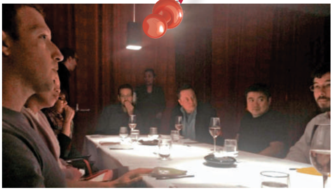
▶ 朱克伯格（左一）和馬斯克（右三）曾與愛潑斯坦共進晚宴。