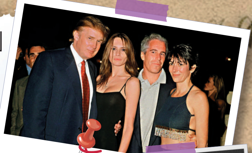
▲▶ 特朗普出現在愛潑斯坦文件中的多張照片上。

美國眾議院司法委員會民主黨首席議員拉斯金稱，他在查閱未刪節的愛潑斯坦文件時搜索特朗普的名字，結果顯示其姓名出現了「超過100萬次」。根據已公布文件，多名女性曾指控特朗普實施性侵，包括一名據稱受害時年僅13歲的女性。加州眾議員劉雲平11日在聽證會上質問司法部長邦迪時提到，一名豪華司機曾舉報特朗普和愛潑斯坦一同強姦了一名女孩，這名女孩事後遭「爆頭」身亡，卻被判定為「自殺」。