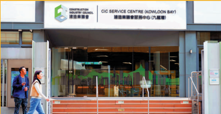
▲建造業議會轄下的香港建造業工藝測試中心為各種工藝及機械操作進行測試，提供資歷證明。

香港建造學院表示，裝修公司或個別單位業主如聘用已完成並持有裝修及維修證書人士進行相關工程，可確保學員的安全知識及工藝水平經過評核，有助確保工程的質量和降低意外風險。同時，工程委託人亦可透過公開名冊，按工程規模搜尋「註冊專門行業承造商」中「室內裝修」類別的公司。此類別要求註冊公司聘用具備半熟練或熟練技工、或曾完成屋宇維修、保養及裝修培訓的註冊建造業工人。倘若出現違規情況，制度亦設有機制處理投訴和規管行動的機制，以保障僱主聘用到合資格及可靠的承造商。