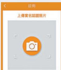
▲「Call師傅」App要求註冊的裝修師傅上傳註冊人士手持許可證／身份證。

Toby App日前回覆《大公報》查詢時表示，Toby平台上的裝修相關服務，主要分為以下兩種模式：（一）裝