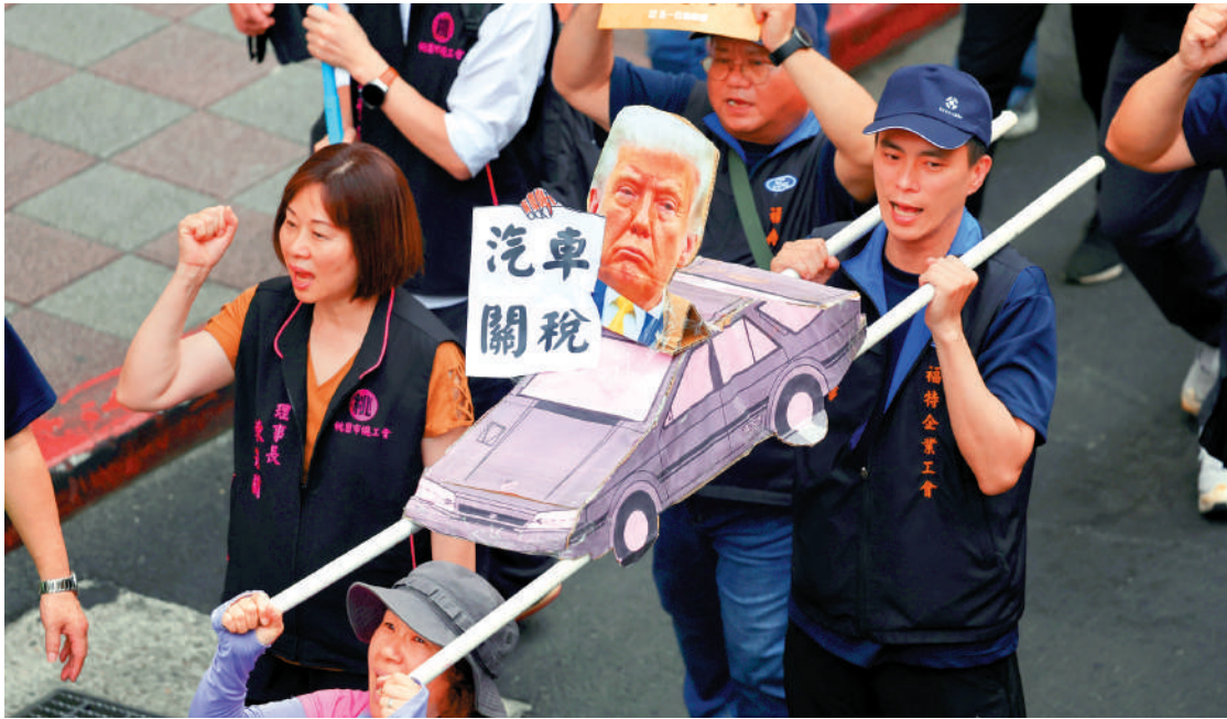
▲台業界憂慮「美車銷台零關稅」恐將影響台灣大批零組件商和數十萬勞工生計。圖為台灣業界舉行集會要求台當局保障勞工權益。