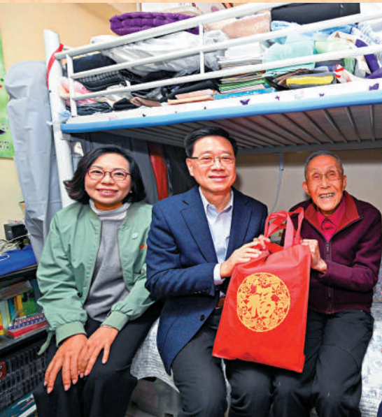
◀李家超了解獨居的坤叔生活狀況，並送上新春賀禮。

李家超昨日率領民政及青年事務局局長麥美娟、勞工及福利局局長孫玉菡到駿發花園探望兩個長者住戶，其中87歲的關生和82歲的關太，曾經分別是足球和跳水運動員，兩夫婦暢談過往在體育方面的戰績，又向特首分享在駿發花園的生活，關太說退休生活很愜意，早上和老友記飲早茶，又經常參加豐富精彩的社區活動，有很多長者友善設施，認為社區以至香港社會對老人家非常友善。