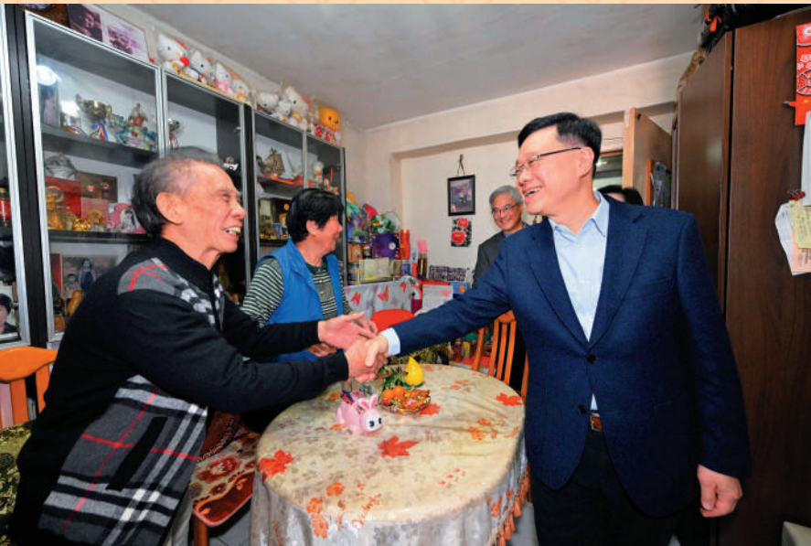
▲李家超到關生關太家中探訪，兩夫婦大讚特首親切。