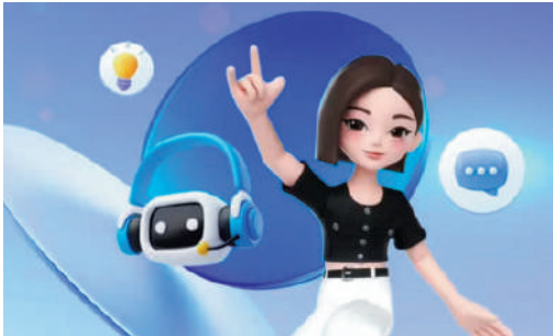
▲豆包大模型2.0在多模態理解、企業級Agent、推理和代碼能力上都有不少提升。

目前，豆包2.0 Pro已面向C端用戶在豆包App、電腦端和網頁版上線「專家」模