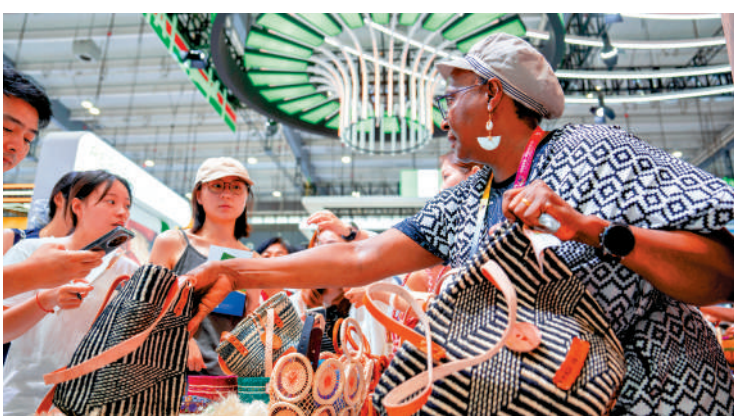
▲在去年於湖南長沙舉行的第四屆中國—非洲經貿博覽會上，參展商（右一）向觀眾介紹非洲商品。

致力於維護世界和平、促進共同發展，推動構建人類命運共同體。中方將於2026年5月1日起對53個非洲建交國全面實施零關稅舉措，同時繼續推動商簽共同發展經濟夥伴關係協定，並通過升級「綠色通道」等進一步擴大非洲輸華產品准入。這是中國擴大高水平對外開放的新舉措，必將為非洲發展、中非共逐現代化之夢提供新機遇。 習近平強調，中非開啟外交關係70年來，雙方始終風雨同舟、並肩前行。中方願同非方一道，傳承歷史情誼，深化互利合作，增進相知相親，共同書寫新時代全天候中非命運共同體新篇章。