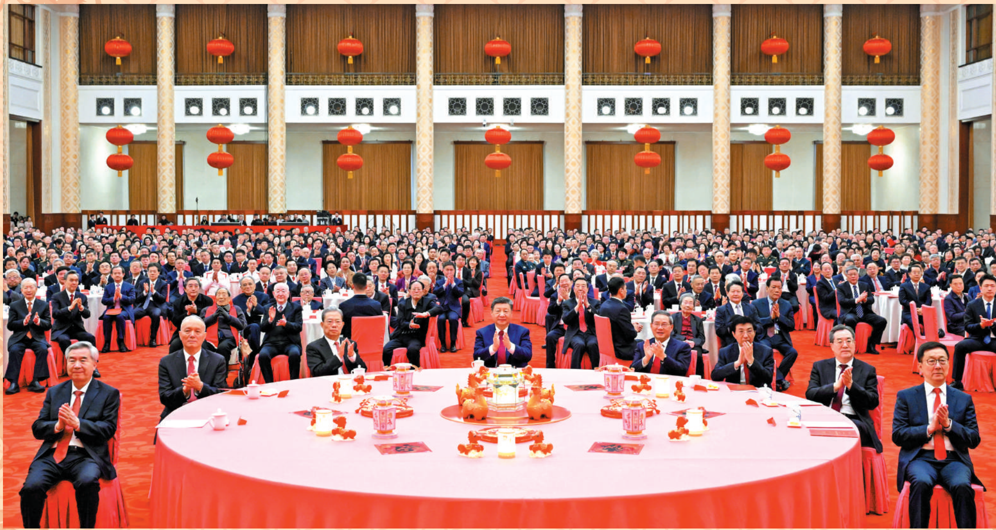
▲2月14日，中共中央、國務院在北京人民大會堂舉行2026年春節團拜會。黨和國家領導人習近平、李強、趙樂際、王滬寧、蔡奇、丁薛祥、李希、韓正等同首都各界人士歡聚一堂，共迎佳節。

中共中央、國務院14日上午在人民大會堂舉行2026年春節團拜會。中共中央總書記、國家主席、中央軍委主席習近平發表講話，代表黨中央和國務院，向全國各族人民，向香港特別行政區同胞、澳門特別行政區同胞、台灣同胞和海外僑胞拜年。 習近平強調，即將過去的乙巳蛇年，是很不平凡的一年。面對複雜多變的國際國內形勢，我們迎難而上、砥礪前行，推動黨和國家事業取得新進展新成效，全年經濟社會發展主要目標任務順利完成，「十四五」圓滿收官，我國經濟實力、科技實力、國防實力、綜合國力躍上新台階，中國式現代化邁出新的堅實步伐。丙午馬年，希望全國各族人民更加緊密地團結在黨中央周圍，堅定必勝信心，保持昂揚鬥志，在中國式現代化新征程上策馬揚鞭、勇往直前，共同開創更加美好的未來。