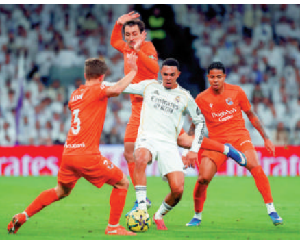
阿諾特（右二）在比賽中。