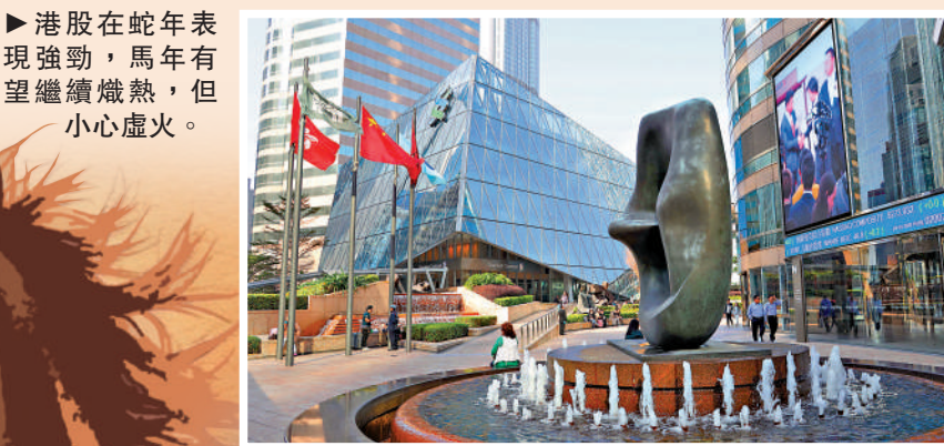
► 港股在蛇年表現強勁，馬年有望繼續熾熱，但小心虛火。