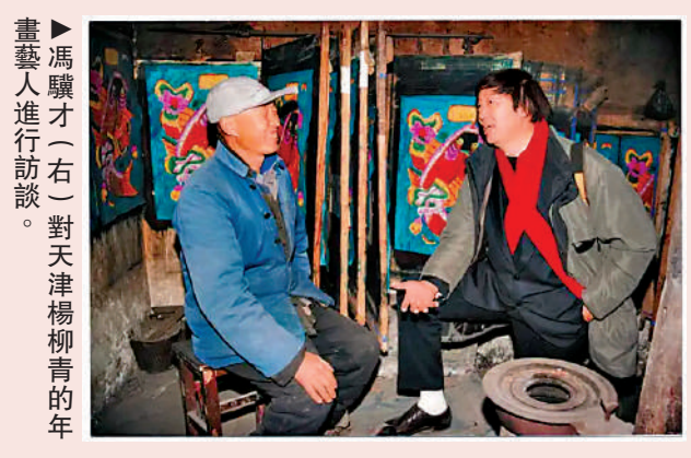
書藝►馮驥才（右）對天津楊柳青的年

在外來文化衝擊和現代生活方式的變革下，年味兒有淡化趨勢，對此，馮驥才十分痛心。他提出，對於年，我們只能加強它，不能簡化它、淡化它。守護春節關鍵在於喚醒人們對春節的情感，而情感的養成有賴於教育和創新。比如，春晚是春節習俗創新的有益實驗。而貼在電腦上的小福字、「灶王爺」冰箱貼等也以符合時代要求的方式傳遞着「年文化」。只要中國人過年的勁頭不減，當代年俗系統就能在創新中充滿活力，春節文化必然會濃郁、美滿、充滿魅力地傳衍下去，讓春節這朵中華民族特有文化之花永遠盛開。