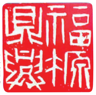
►印：福源鼎盛。 作者：戴武。