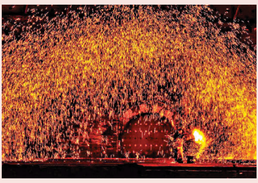
►《過年書》，馮驥才著，作家出版社，2025年。

「前兩天有記者問年該怎麼過？我笑着反問，過年還用人教嗎？我的答案是，從來年是有情日，誰想過年誰想轍。」馮驥才先生在寫於2008年元月的《春節八事》中如是說。馮驥才愛過年，也愛年的文化、藝術和情感，他說：「寫年，說年，談年，論年，是我的工作的一部分。」2024年底春節申遺成功，藉此契機，他選了五十篇和年有關的文章，編為《過年書》。這本書雖出版於2025年，內容卻是常讀常新，春節期間讀之，尤為如此。