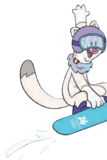
►蘇翊鳴輕咬男子單板滑雪坡面障礙技巧金牌。

出生日期： 2004年2月18日 (22歲) 出生地： 吉林省吉林市 項目： 男子單板滑雪 (大跳台、坡面障礙技巧)