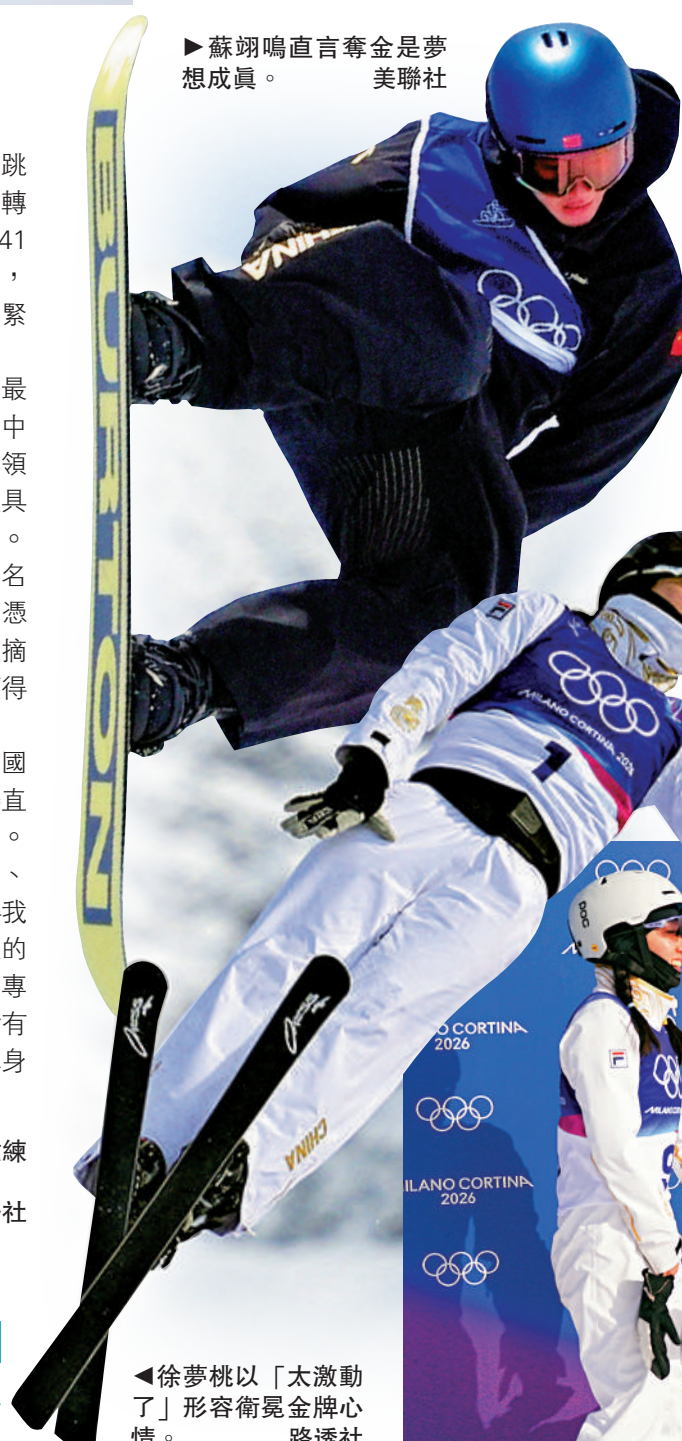
◀徐夢桃以「太激動了」形容衛冕金牌心情。