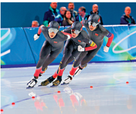
38◀中國速度滑冰男子隊以3分41秒38的成績戰勝荷蘭隊，獲得銅牌。中新社