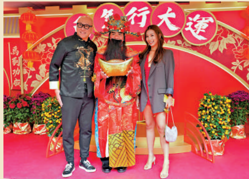
▲市民與財神（左二）合照，祈求財源廣進。

場內祝福之聲不絕，財神甫一亮相即成焦點。在傳統文化中，財神象徵財富好運，人們相信接觸財神能沾上財氣，祈求財源廣進。沙田馬場內的財神爺吸引大批市民遊客排隊輪候合照，希望為馬年取個「財來運起」的好彩頭。