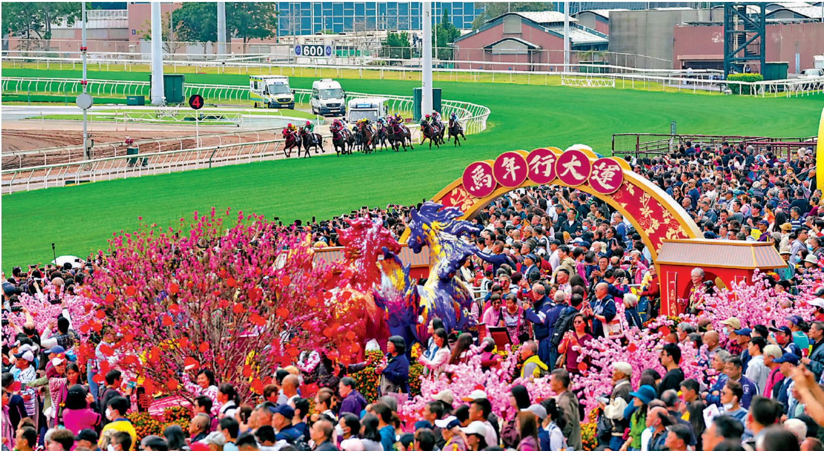
▲「馬年賽馬日」吸引近10萬人入場，旺丁旺財。