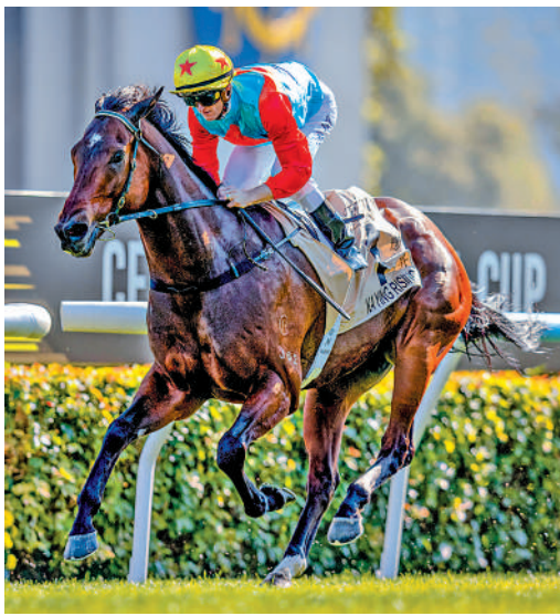
念盃。 ▲「嘉應高昇」年初六將出戰一級賽女皇銀禧紀念盃。

「精英大師」於2002年12月至2005年4月期間創下目前保持的連勝紀錄，其最後勝仗是2005年遠赴日本場威1200米一級賽短途馬錦標，現年26歲的牠正在澳洲牧場享受退役生活，至今仍獲公認為香港賽馬史上最偉大的賽駒。