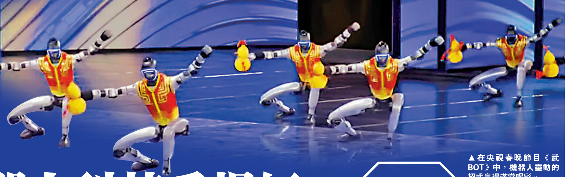
▲在央視春晚節目《武BOT》中，機器人靈動的招式贏得滿堂喝彩。

央視旗下的「日月譚天」3月3日發表題為《春晚機器人科技秀改變台灣社會三個認知》的文章。文章指出，春晚上機器人帶來的科技秀，正在島內鋪天蓋地的討論中悄然重塑台灣社會的認知，讓越來越多島內民眾看清大陸日新月異的發展。春晚機器人話題爆火而且後勁十足，至少正在三個方面改變台灣社會認知。