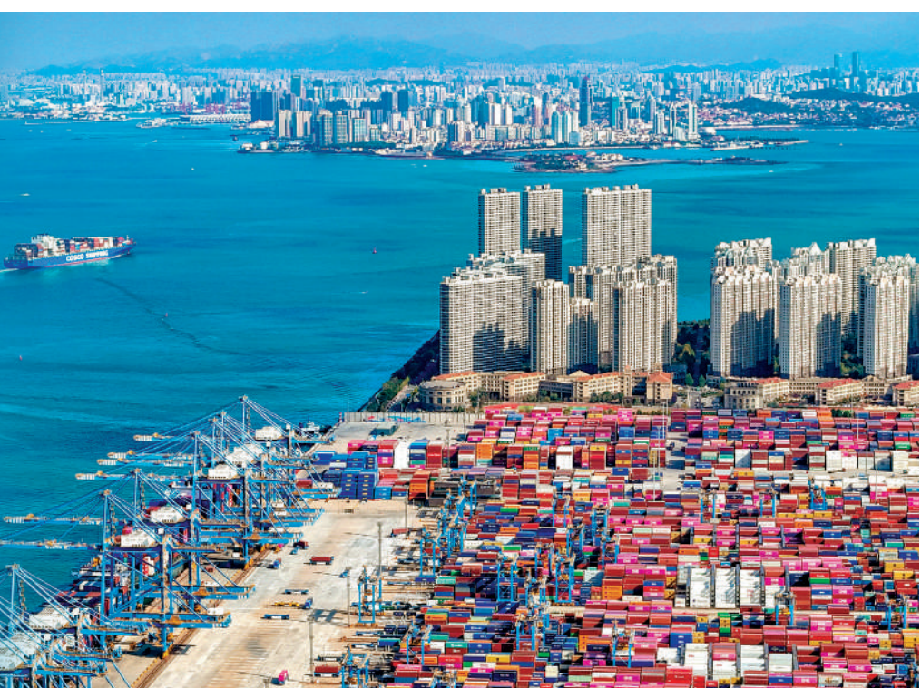
由於外需強勁，中國出口首兩個月大幅增長。