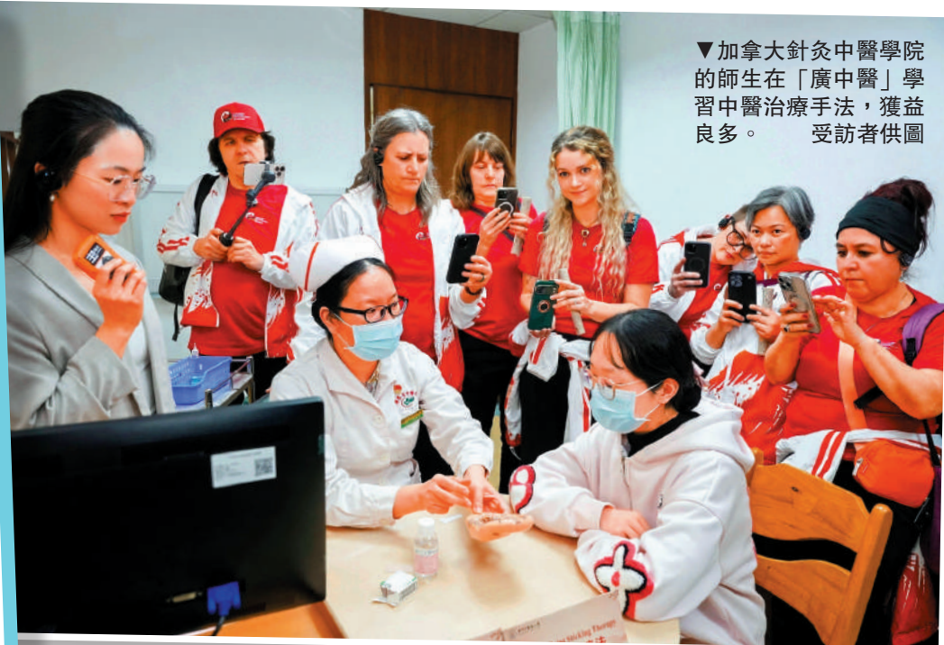
▼加拿大針灸中醫學院的師生在「廣中醫」學習中醫治療手法，獲益良多。

分。他鼓勵加拿大交流團成員多走、多看、多體驗，從一針一灸、一草一木中感受東方醫學的智慧，成為中醫藥文化的傳播者，讓更多人認識中醫藥、受益於中醫藥。