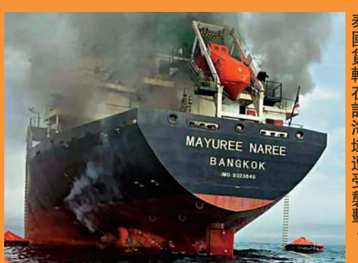
中東戰事致霍爾木茲海峽被封鎖，影響石油運輸。圖為一艘泰國貨輪在該海域遭襲擊。

有業內人士表示，高盛的報告帶出了一個重要訊息，當市場認為布蘭特原油回落至每桶100美元關口之下，情況便有所緩和，但實際上成品油的溢價仍然高企，因成品油供應比原油更短缺，如航空煤油的溢價便曾一度飆升至每桶100美元，意味著每桶航煤的價格幾乎是布蘭特原油價格加上100美元，溢價幅度極為驚人。