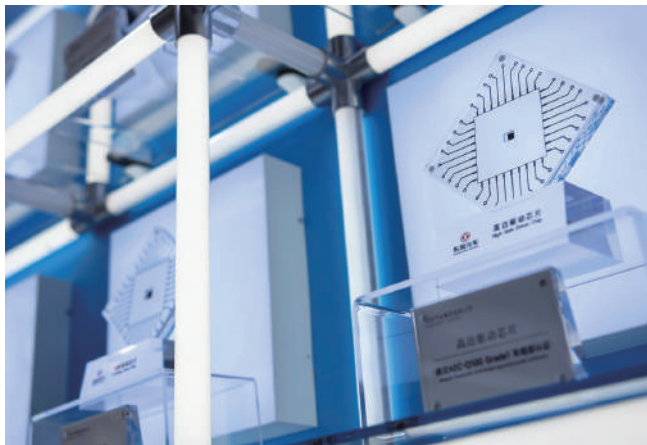
▲中國科技自強自立取得成果，國產AI芯片產業迅速崛起。