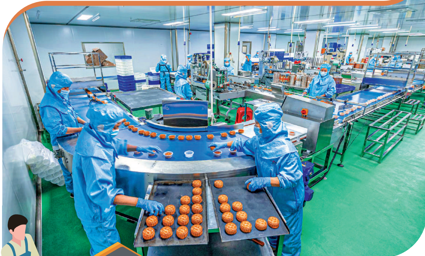
▲今年前兩個月，廣東規模以上工業增加值同比增長7.9%。圖為廣東一家食品工廠工人在生產車間內忙碌。

此外，廣東外貿方面延續強勁表現。前兩個月，廣東進出口總額同比增長22.1%，規模創歷史同期新高，其中出口增長22.6%，進口增長21.3%，延續「開門紅」勢頭，成為穩增長的重要支撐。