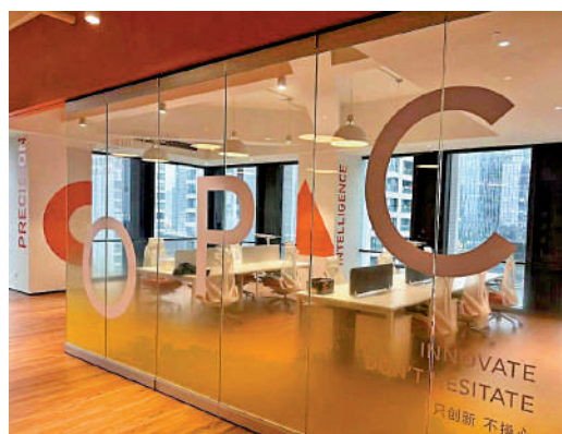
▲前海OPC國際社區於日前啟動入駐申請。

為支持創業全周期，前海量身定製了「8個零」政策，包括提供最高200平方米、最長2年的「0負擔」創業空間，人均最高50平方米的「0操心」保障性租賃住房，每年最高50P免費算力及主流大模型最長3個月免費試用的「0成本」智算服務，開放各類「人工智能+」應用場景並定期發布需求清單的「0距離」場景對接，以及專屬創業貸、人才貸等「0抵押」信貸產品，配套種子基金、天使投資基金的「0顧慮」融資支持，優秀團隊帶頭人每年最高60萬元人民幣的「0等待」人才獎勵，和覆蓋工商、開戶、出海、知產等一站式服務的「0跑腿」綜合服務，同時開通國際互聯網訪問以便利獲取海外資源。