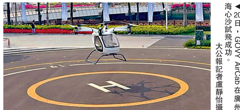
▲20日，GOVY AirCab在廣州海心沙試飛成功。

「隨著這些底層能力逐步完善，加上應用場景持續拓展，我們判斷到2027年，行業將具備向載人階段過渡的條件。」他表示，屆時有望出現一批取得適航認證、具備較高安全性的載人飛行器，進入實際運營測試階段，2027年或成為低空載人商業化的「元年」。