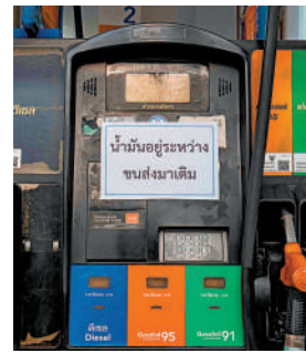
▲泰國曼谷一家加油站16日因缺油暫時關閉。

千方百計 美國和以色列對伊朗開戰滿三周，導致全球關鍵能源和物資運輸通道霍爾木茲海峽「梗阻」、多地油氣設施遇襲，石油和天然氣價格飆升。多國被中東戰火負面外溢效應波及，能源供應不穩，緊急採取釋放石油儲備、限制能源價格、能源配給等措施。國際能源署（IEA）20日提出居家辦公、避免搭乘飛機出行等節能建議。這場危機亦促使各國重審能源政策，尋求加快能源轉型或實現能源供應多元化。