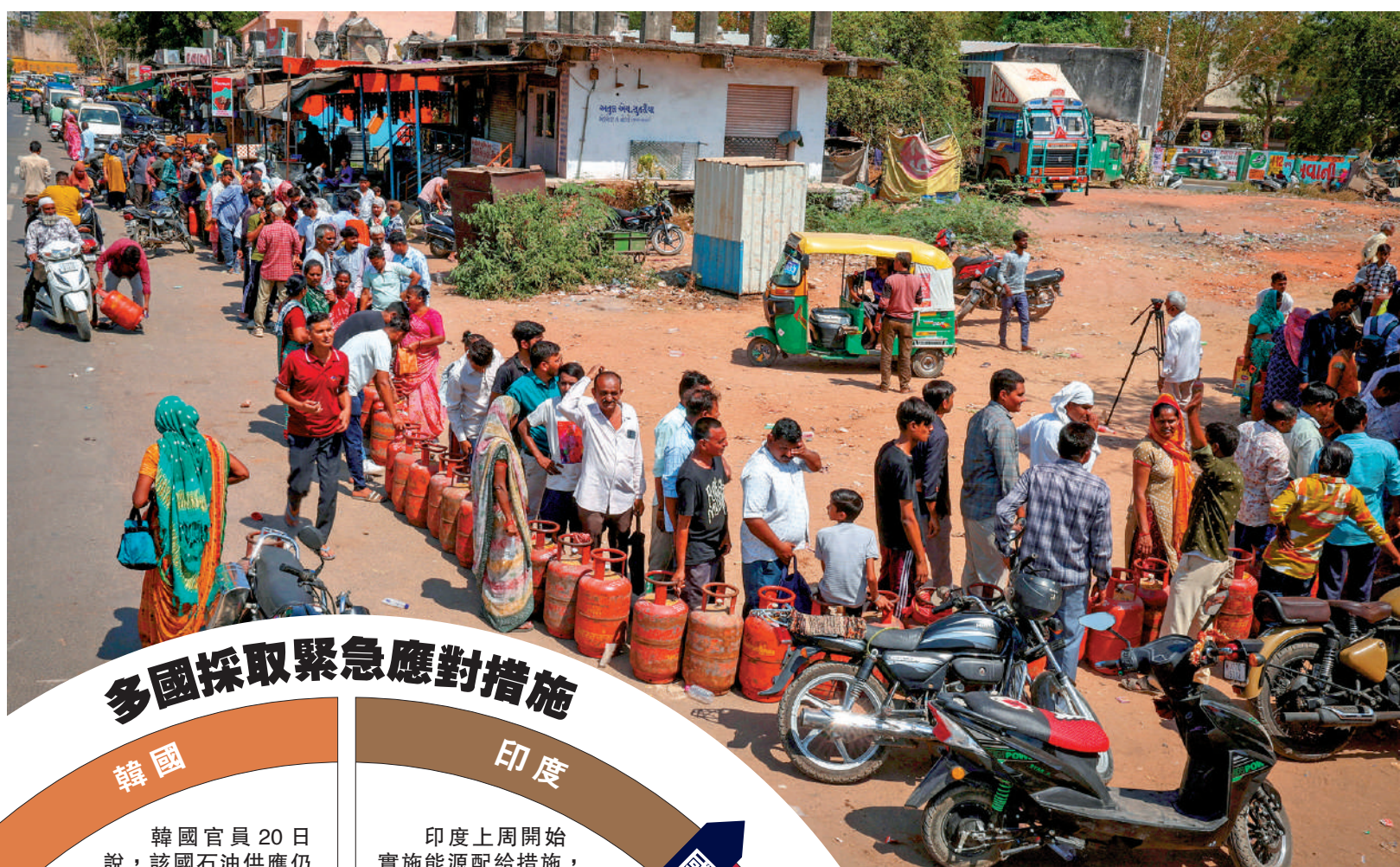
▲印度液化石油氣短缺，艾哈邁達巴德一家氣站12日大排龍。