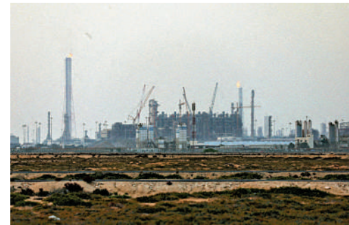
▲卡塔爾天然氣設施被戰火波及，影響未來數年出口產能。

斯石油的制裁，並可能對約1.4億桶已在海上的伊朗石油採取同樣措施，以增加市場供應。