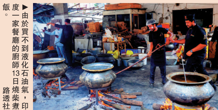
▶由於買不到液化石油氣，印度一家餐廳的廚師13日燒柴煮飯。

專家認為，如果能源危機持續，各方可能更願意加速能源轉型，尤其是發展中國家。埃塞俄比亞、津巴布韋等非洲國家亦出現油價上漲、交通運輸成本增加等問題。埃塞俄比亞電力公司公共關係主管梅柯嫩表示，這為非洲各國政府敲響警鐘，各國應推廣使用電動汽車，尋找替代能源，尤其是可再生能源。