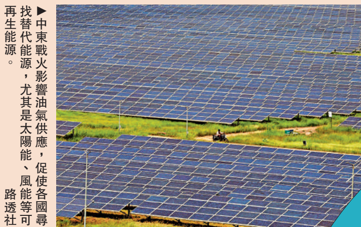
▶中東戰火影響油氣供應，促使各國尋找替代能源，尤其是太陽能、風能等可再生能源。

IEA於19日說，其32個成員國上周一決定釋放共計4億桶戰略石油儲備後，相關儲備已開始向市場投放。此次石油儲備釋放規模為史上最大，其中美國將釋放1.72億桶；日本近8000萬桶；加拿大2360萬桶；韓國2250萬桶；德國1950萬桶。IEA還呼籲各國政府、企業和家庭從需求端着手應對危機，並提出一系列建議，包括推廣居家辦公、將高速公路限速下調至少10公里每小時、盡量避免乘坐飛機、烹飪時改用電力而非液化石油氣等。