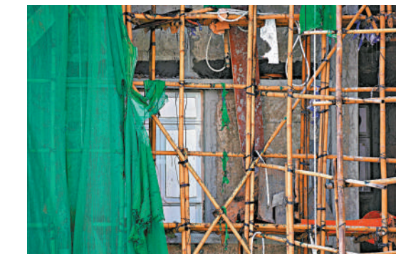
▲宏福苑大維修工程的棚網及封窗發泡膠均被揭發有問題。