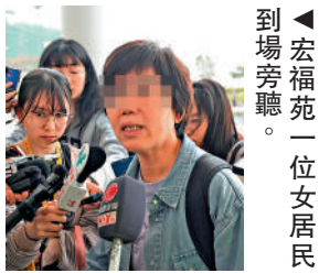
▲宏福苑一位女居民到場旁聽。