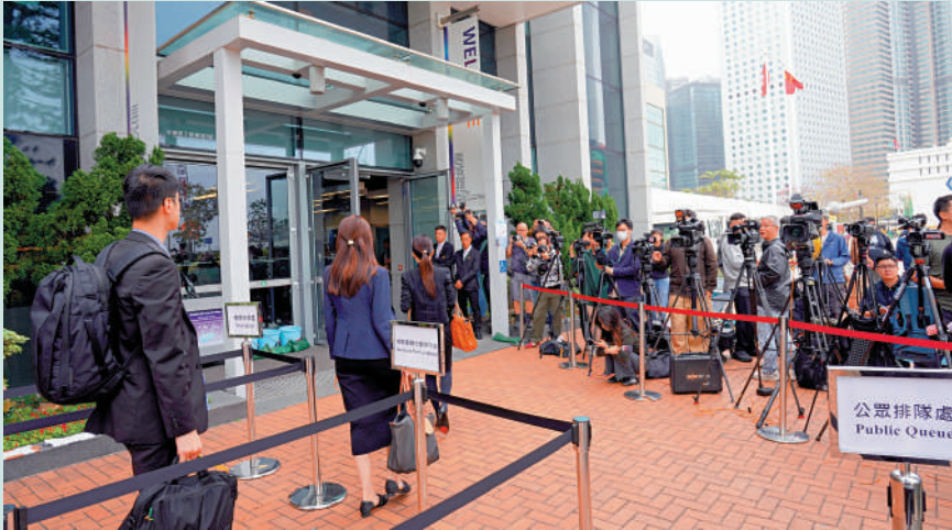
▲宏福苑火災獨立委員會昨日舉行首輪第二場聽證會。

杜淦堃指出，有居民提到在業主大會無權提問，大會不設問詢環節，發現自己未授權但出現授權票，後續討論時發現，宏業在屋宇署網頁顯示有定罪紀錄且不能續牌，其小型工程