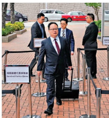
▲政府代表律師出席聽證會。

會按其建議進一步完善和優化制度改革，並採取適當的跟進行動。基於尊重個人私隱，政府不便提供個別政府僱員的資料。