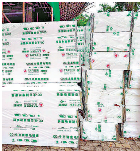
▲圖為第一批運抵宏福苑的發泡膠板。