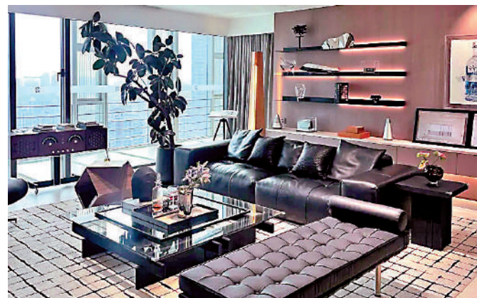
▲越秀·東山雲起住宅樓層位於 8 樓以上，景觀開揚。