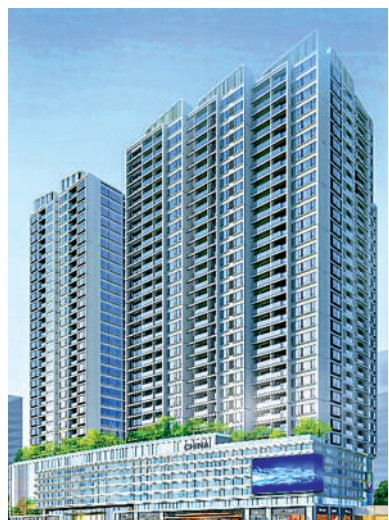
▶越禧府由 3 幢 30 層高住宅組成。