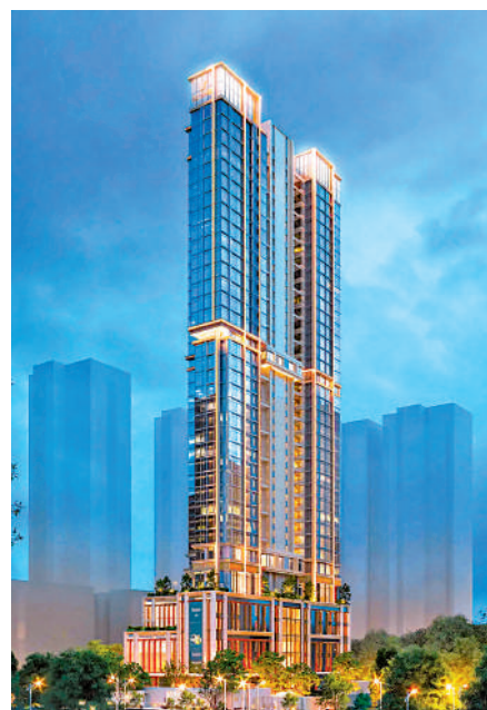
▲越秀·東山雲起為單幢式住宅，位於越秀區核心地段。

越秀·東山雲起為單幢式住宅，樓高 38 層，地積比率為 3.8 倍，一層四戶布局，配套設施在底部 6 層，7 樓為架空層，從 8 樓起才是住宅區域，因此房源僅 116 伙。其中，99 平米為項目最火的戶型，佔比達 50%，通過新設計（露台不計容積率，佔比 20%），使用率超過 100%，通過靈活改造，可打造三房甚至四房戶型，滿足三代同堂或二孩家庭的需求；122 平四房戶型是雙套房設計，主人套房帶全景窗台，次睡房與客廳相連，適合注重隱私的家庭；139 平四房戶型貨量最少，僅 15 伙，做到四房三浴室雙套房，入戶前廳、窗台、花池等贈送空間尺度慷慨，適合追求大空間的換樓客戶。