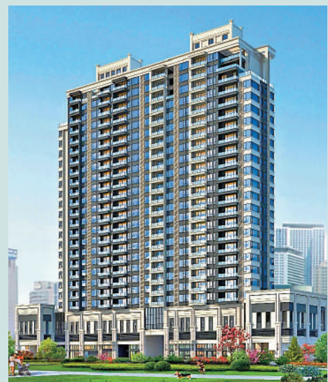
▲公園前·君熙府總建築面積僅 2.38 萬平方米，提供 121 個單位。

綜合來看，公園前·君熙府並非單純的住宅項目，它是越秀區稀缺資源的集大成者。對於習慣了老城區生活節奏、看重子女教育與長輩醫療、且追求高品質居住環境的改善型買家而言，這裏無疑是「回歸中心」的最佳選擇。