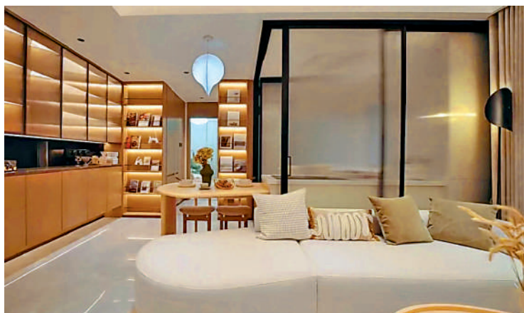
▲越禧府主推單位面積 71 至 135 平米，滿足不同家庭需要。