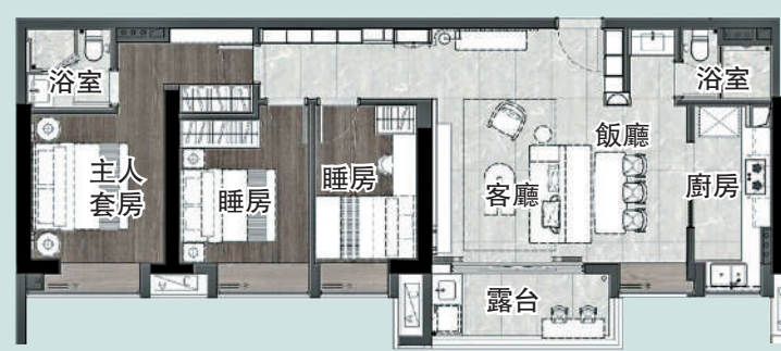
▲公園前·君熙府 115 平米三房兩廳戶型圖。