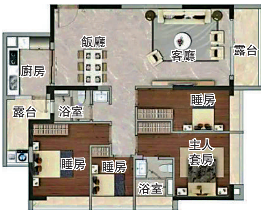
▶越禧府 135 平米四房兩廳戶型圖。