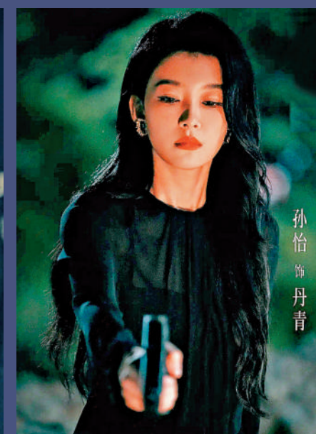
孫怡出演女主角丹青，人設複雜。