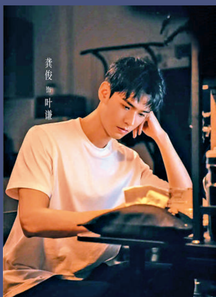
內地演員龔俊在《風過留痕》飾演男主角葉謙。