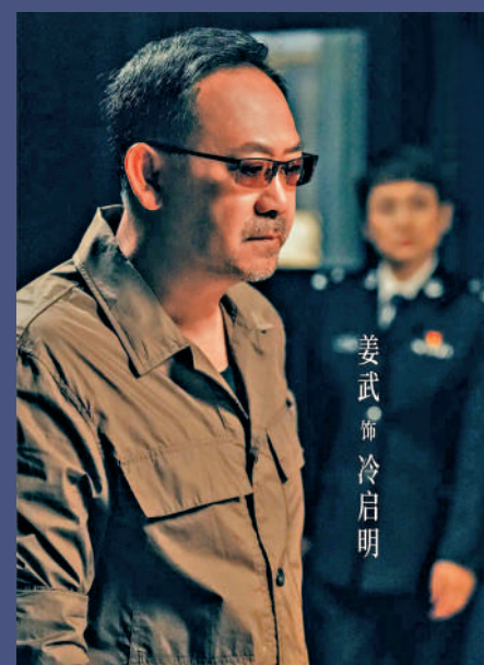
姜武出演資深警察冷啟明。