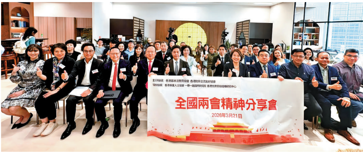
▲全國兩會精神分享會昨日舉行，一眾講者深入剖析國家發展方向與香港的角色定位。

香港基本法教育協會及香港對外交流友好協會主辦的「2026年全國兩會精神分享會」昨日舉行。是次活動聯同香港專業人士協會、一帶一路國際研究院及香港世界貿易組織研究中心協辦，並且同步設網上直播，匯聚多位港區全國人大代表、全國政協委員、立法會議員及專家學者踴躍參與分享，圍繞全國兩會精神及「十五五」規劃開局之年的重要意義，深入剖析國家發展方向與香港的角色定位。