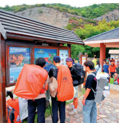
▲部分熱門營地計劃試行預約制。

對熱門營地實施預約制度，目的是加強對營地設施管理，避免熱門營地人滿為患。政府一些熱門康體設施亦實施預約制度，希望市民公平使用。一些熱門康體設施由於求過於供，衍生炒場情況。有人利用公共設施無本生利，情況有如免試更換駕駛執照的排隊黨一樣。