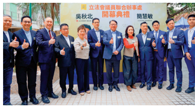
▲陳國基昨日出席吳秋北及簡慧敏的議員辦事處開幕禮。

立法會議員簡慧敏表示，自己在金融法律界累積了一定經驗，作為選委會界別議員，她也很關心打工仔強積金等議題，希望日後大家多多前來辦事處交流，她與團隊會傾聽大家的意見，做好上傳下達的工作。