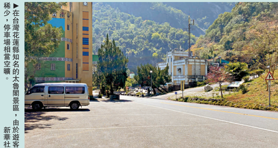
在臺灣花蓮縣知名的太魯閣景區，許多餐館到了午餐時間仍少有客人，多個停車場較為空曠。一家牛肉麵店業者表示，這幾年客人少了七八成。如今，島內旅遊業的光景已遠不如陸客曾大量來台時。沒有了陸客，台灣旅遊業復甦緩慢。島內業界呼籲民進黨當局盡快恢復兩岸旅遊往來正常化，重啟陸客赴台遊。