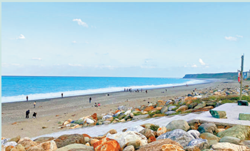
台灣花蓮七星潭景區是不少陸客必來的打卡地。但近年陸客赴台受阻，該景點遊客寥寥無幾。

在臺灣花蓮縣知名的太魯閣景區，許多餐館到了午餐時間仍少有客人，多個停車場較為空曠。一家牛肉麵店業者表示，這幾年客人少了七八成。如今，島內旅遊業的光景已遠不如陸客曾大量來台時。沒有了陸客，台灣旅遊業復甦緩慢。島內業界呼籲民進黨當局盡快恢復兩岸旅遊往來正常化，重啟陸客赴台遊。