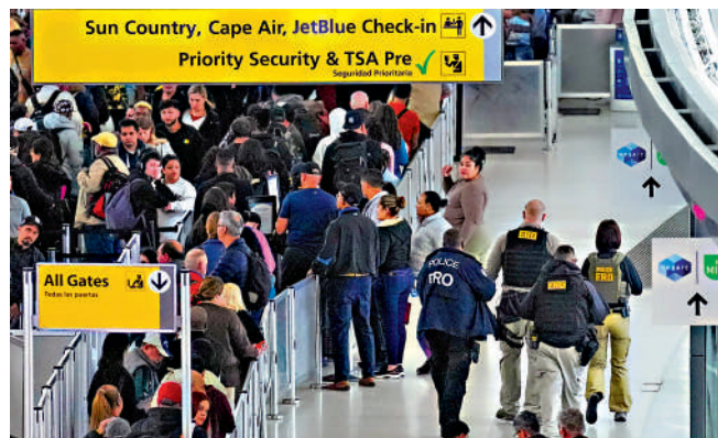
▲移民執法人員23日現身紐約肯尼迪國際機場，但並未解決安檢大排長龍的問題。

隸屬美國國土安全部的ICE特工今年1月在明尼蘇達州暴力執法，甚至開槍打死兩名美國公民，是此次國土安全全部停擺的導火索。民主黨要求ICE進行改革，否則拒絕通過國土安全全部撥款法案。