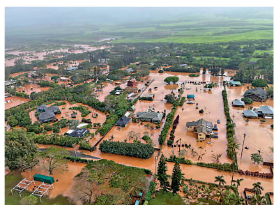
▲夏威夷近日發生嚴重洪災，大片房屋被洪水淹沒。

現強降雨，新一輪暴雨引發嚴重洪災，摧毀房屋、沖走車輛。夏威夷當局一度對檀香山北部約5500人發布撤離令，並警告說，當地有120年歷史的瓦西阿瓦水壩面臨即將潰壩的風險。夏威夷當局仍在繼續監測大壩的情況。受洪災影響，夏威夷電力公司20日切斷客戶電力供應，目前正在逐步恢復供電。截至當地時間22日下午，瓦胡島北岸約1200戶已恢復供電，但仍有超過2000戶無電可用，工作人員正在繼續搶修並評估損失。