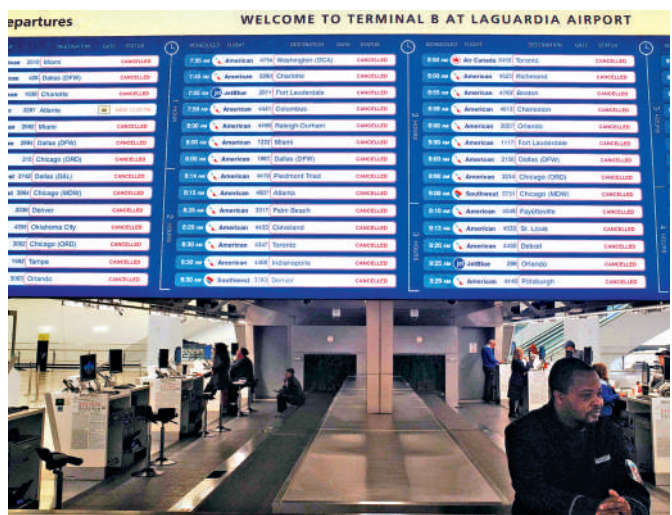
▲拉瓜迪亞機場大量航班23日顯示已取消。