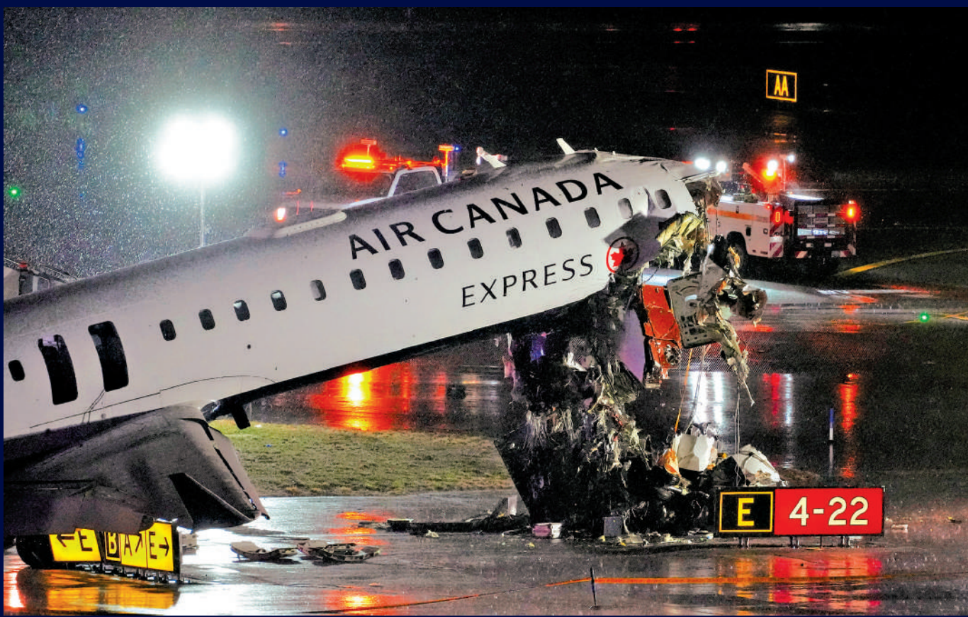
▲發生碰撞事故的客機頭部嚴重損毀，兩名飛行員不幸身亡。

當地時間22日晚，加航快捷航空8646航班在美國紐約拉瓜迪亞機場降落時撞上一輛消防車，造成客機兩名飛行員死亡、41人受傷。事發機場緊急關閉，數百個航班被取消。空中交通管制錄音顯示，空管員事發時手忙腳亂，先是批准消防車穿越跑道，又連聲叫停，但為時已晚，只能承認自己「搞砸了」。具體事故原因仍在調查中。分析人士指出，美國空管人手不足無疑增加了安全風險。