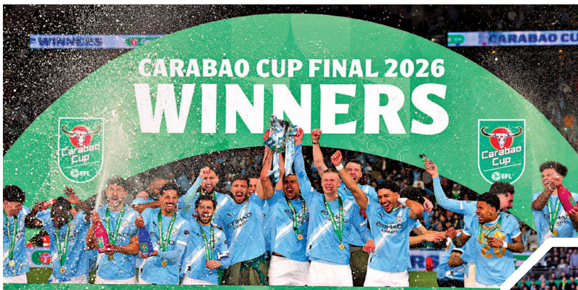
▲曼城球員出席領獎儀式。

阿仙奴近4次殺入英聯盃決賽都無功而還，但阿迪達相信球隊會立即反彈，他說：「之前我們大概踢了50場，每次打和或輸波後下一場總會再次獲勝，我相信今次亦如是。」