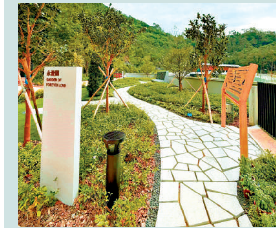
▲食環署石門靈灰安置所的「永愛園」，已於2025年9月26日啟用。