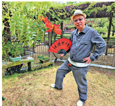
新，居住在這裏十分享受。