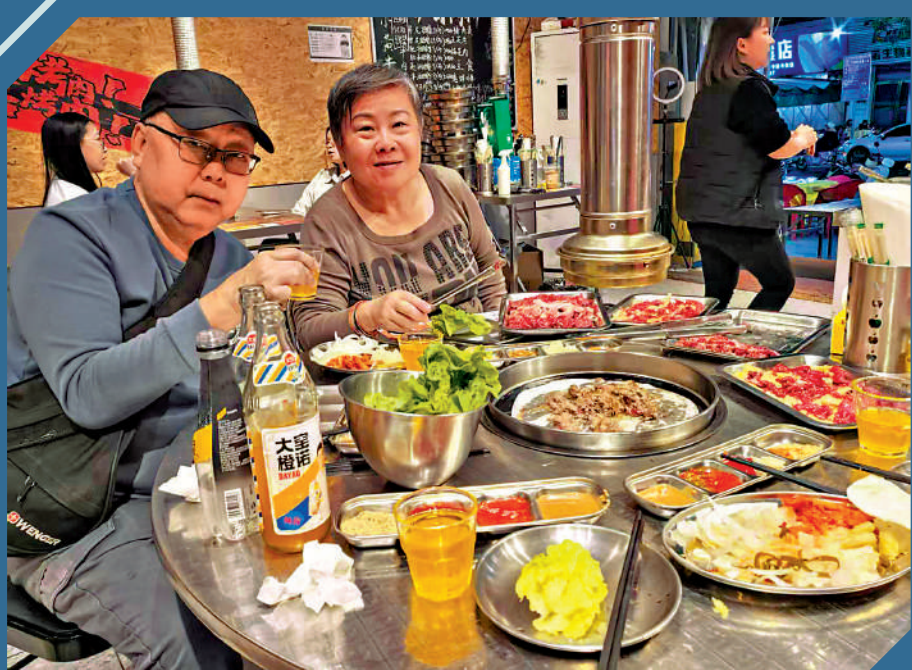
▲李先生與太太表示，在中山一有時間便自駕遊，四處吃喝玩樂，生活忙得很。