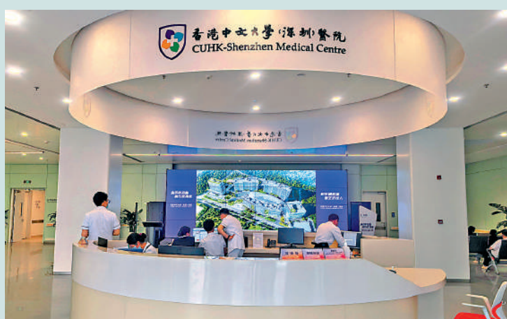
▲香港中文大學(深圳)醫院已於去年11月正式啟動門診試運營，預計將於今年內全面開放。