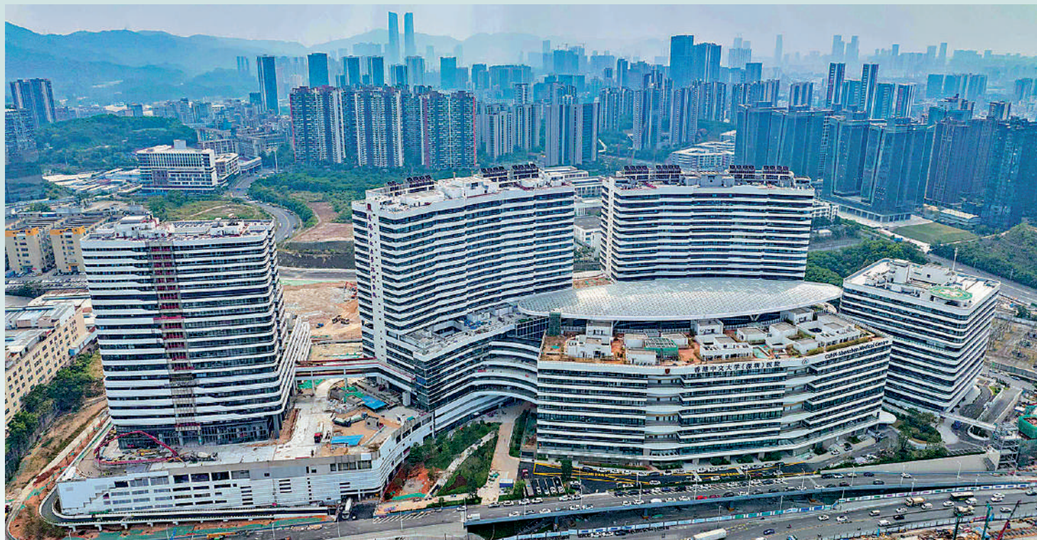
▲香港中文大學(深圳)醫院位於深圳龍崗區坂田街道，規劃床位3000張。