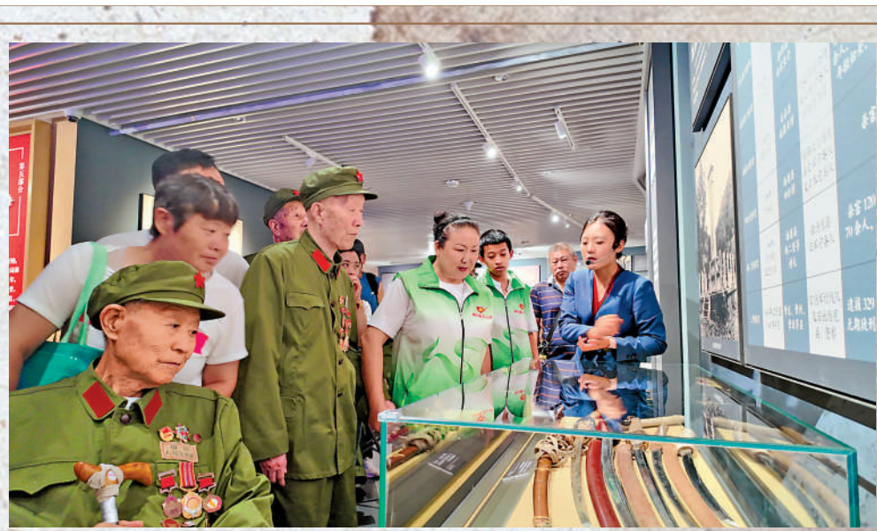
▲八位抗戰老兵參觀吉林省近現代史展覽時，在日本軍刀前久久駐足。