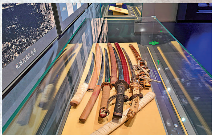
▶吉林省長春豐樂劇場修繕時發現的五柄日本軍刀。