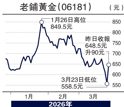
近日金價跌至接近4000美元，香港99金每兩回落至4萬港元，飾金銷售大增。

雖然金價回落，仍屬正常調整，金價處於4300美元水平，過去一年的升幅仍有50%，提供不俗收