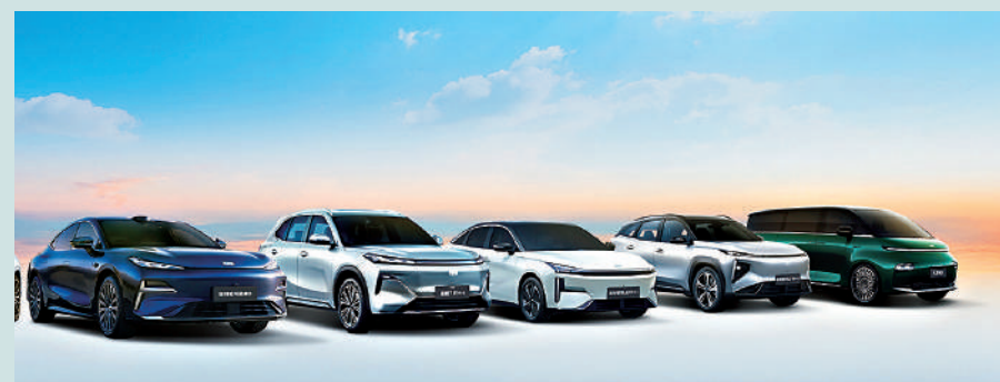
▲吉利上季總銷量按年升24%，其中銀河品牌銷量按年大增73%。