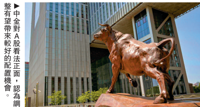
整有望帶來較好的配置機會。認為調

中金建議關注以下主線，第一，景氣成長：受益於AI技術落地的行業如光通信、存儲；新能源相關的電池、儲能等。第二，周期資源股：綜合考慮產能周期位置，關注供需格局支撐漲價及業績確定性的細分領域，如電網、化工等。