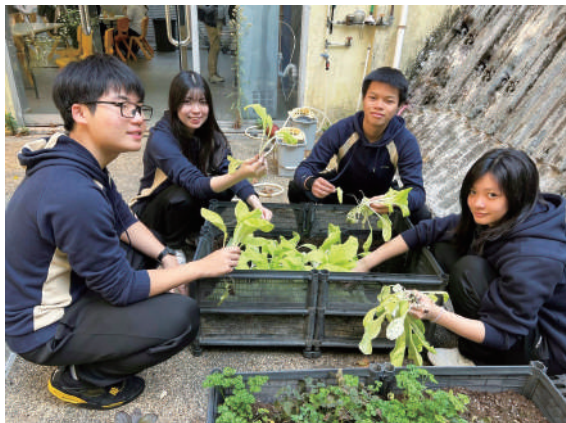
▲同學主動策劃並參與「Design for Change」計劃，利用學校廚餘種植蔬菜，回饋社區長者。

在評核安排方面，Cambridge IAL採用分階段評核（Staged Assessment）機制。學生可先完成