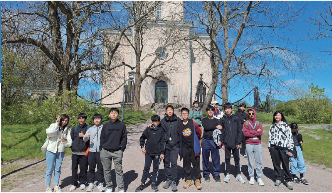
▲公理書院舉辦「海外創新創業文化交流團」，帶領初級學生赴芬蘭進行實踐與體驗式學習，並參訪當地科技企業。

開辦Cambridge IAL，旨在為學生提供與國際教育標準接軌的學習機會，拓闊全球視野，提升學術能力與跨文化理解力，為銜接本地及海外高等教育作好準備。