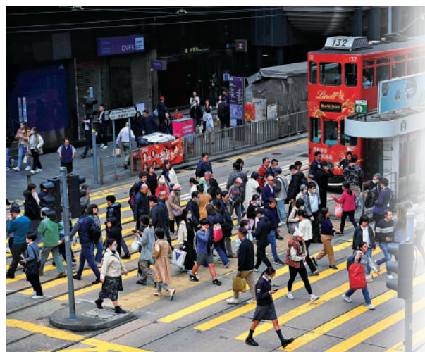
▲最新統計顯示，3月份強積金平均回報料錄得負6.33%。

積金局回應表示，強積金是跨越40年的長線投資，無人能準確預測未來市場走向，成員應定期審視投資，建立多元化投資組合以分散風險。對於沒有時間或不熟悉管理強積金投資的成員，局方建議可考慮俗稱「懶人基金」的預設投資策略。積金局指，DIS分散投資於環球股票及債券市場，加上「隨齡降險」的自動調節機制，能有效減低風險，且設有收費上限，間接增加投資淨回報。