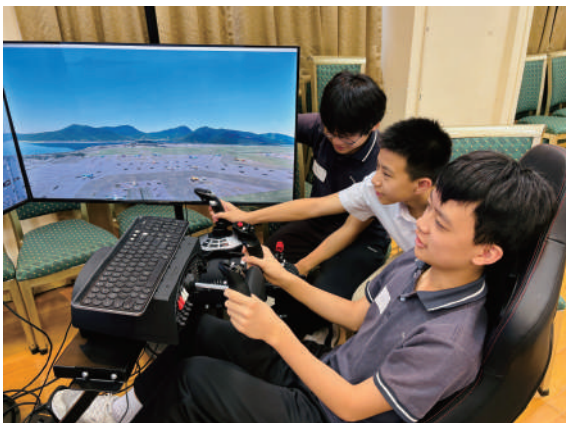
▲學校重視欣賞學生多元才能，融合生命教育與多元學習，協助學生發掘興趣、強項與潛能，規劃未來發展。

在拓展升學選擇的同時，學校更重視學生的全人發展與長遠成長。公理書院始終堅持「多元發展」的教育理念，深信未來社會瞬息萬變，學生必須具備全面而均衡的核心能力。