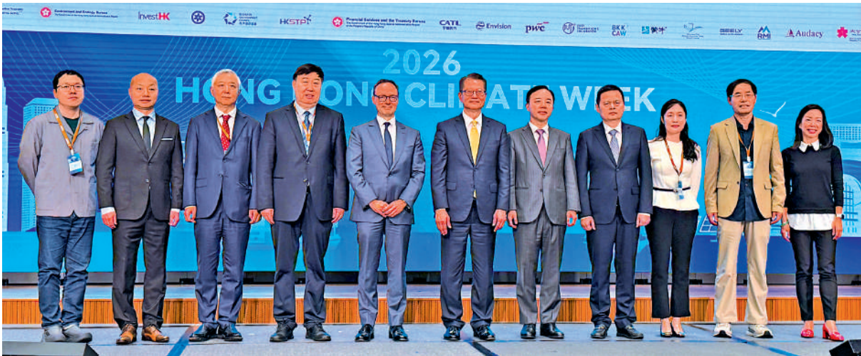
▲香港大學氣候與碳中和研究院發起的「香港氣候周2026」，專家與企業代表等討論應對氣候變化的前沿方案。

陳茂波在開幕致辭表示，全球氣候挑戰嚴峻，但背後隱藏巨大機遇，香港應立即採取行動。他指出，在國家及區域邁向碳中和的進程中，香港應當發揮其獨特優勢，進行可以亦應該承擔的工作，包