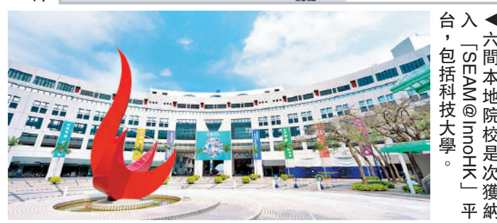
▲InnoHK是香港重點創科項目。