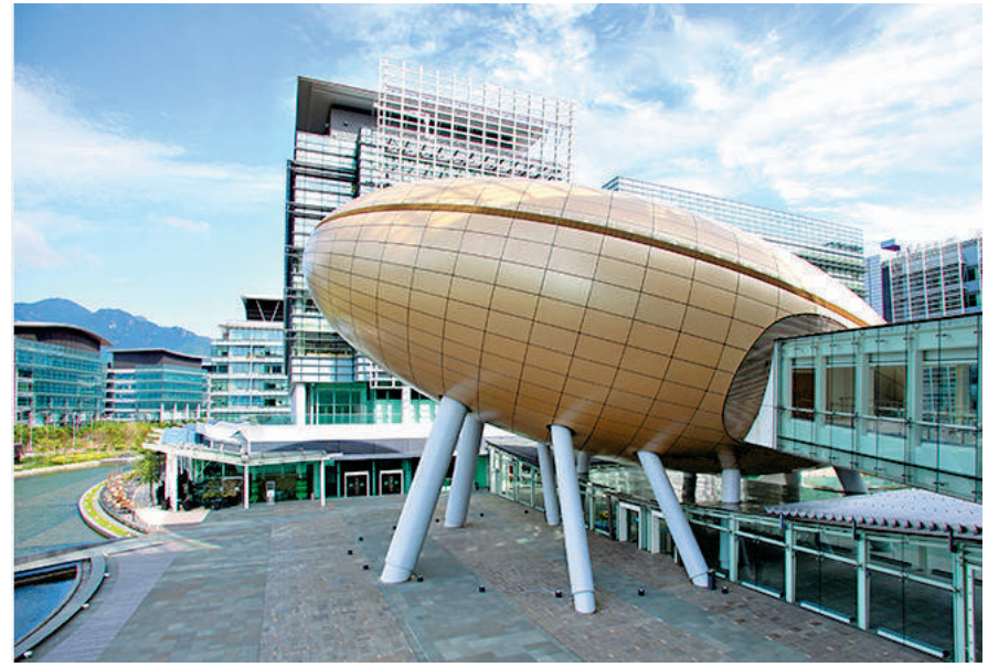
▶創新科技署將與各界合作，確保創科項目順利推行。