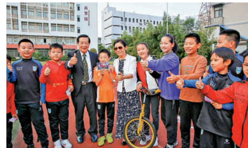
▲2019年李昌鈺攜夫人來到江蘇如皋市師範學校附屬小學參觀，和小學生現場互動。