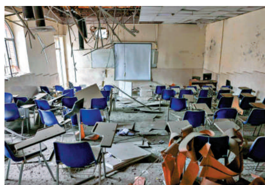
▲伊朗一所大學28日遭空襲，教學樓受損。