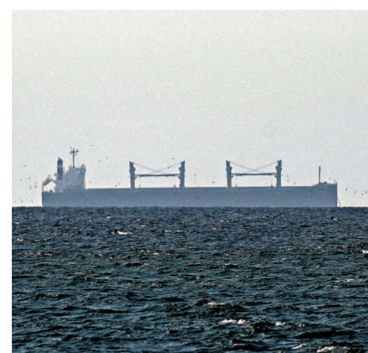
▲美以伊衝突爆發以來，多國貨船和油輪滯留在霍爾木茲海峽附近。

伊朗多次表示，霍爾木茲海峽並未完全關閉，只是對「敵人」關閉。但美以伊衝突期間多艘船隻遇襲，導致大量船隻不敢通行。29日，美以襲擊了位於伊朗霍爾木茲省的一個碼頭，該碼頭鄰近霍爾木茲海峽。襲擊造成5人死亡、4人受傷。