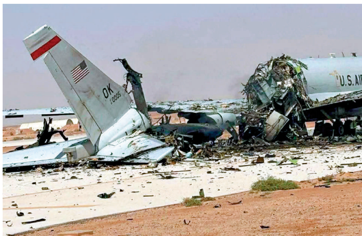
▲伊朗媒體公布部署在沙特的一架美軍E-3「哨兵」預警機被擊毀的照片。