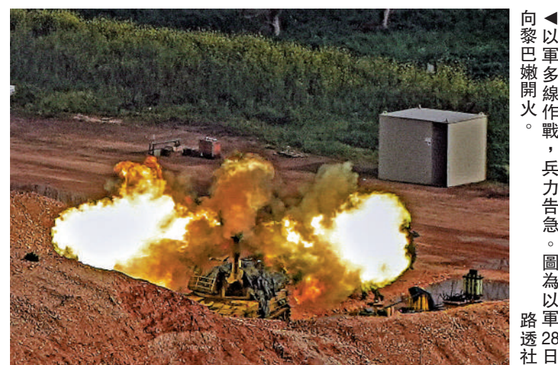
▲以軍多線作戰，兵力告急。圖為以軍28日向黎巴嫩開火。

線電視新聞網（CNN）採訪團隊動粗，不僅持槍恐嚇，其中一名士兵還以鎖喉方式將一名攝影記者按倒在地。