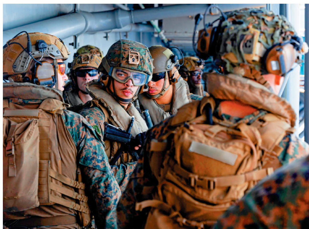
▲美軍中央司令部28日公布「的黎波里」號兩棲攻擊艦上士兵的照片。