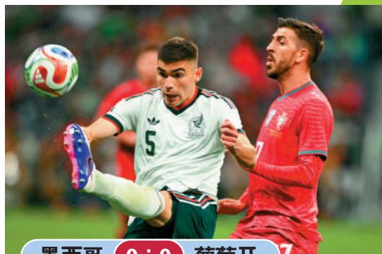
墨西哥 0:0 葡萄牙

美國繼續一週歐洲球隊「實力現形」，在阿特蘭大主場迎戰比利時，雖由韋斯頓麥堅尼先拔頭籌，但客軍憑阿士東維拉中場阿馬度奧拿拿、阿特蘭大攻中基迪拿尼等建功而反先5:1，最終美國追成2:5完場。美國對上兩次面對歐洲球隊，分別大敗於瑞士0:4及以1:2不敵土耳其，而今屆分組賽美國亦有機會重遇土耳其。