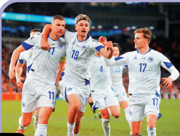
▲波斯尼亞於世界盃附加賽4強賽，反勝威爾士展現球員的爭勝心極強。