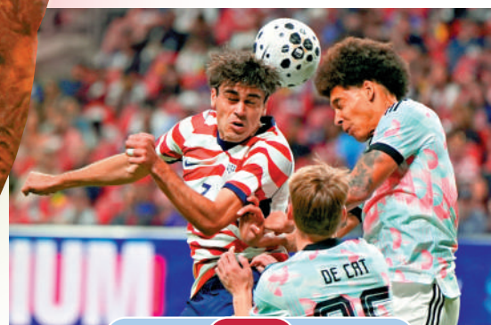
美國 2:5 比利時