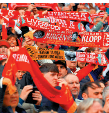
▲利物浦球迷高舉支持高洛普的圍巾。