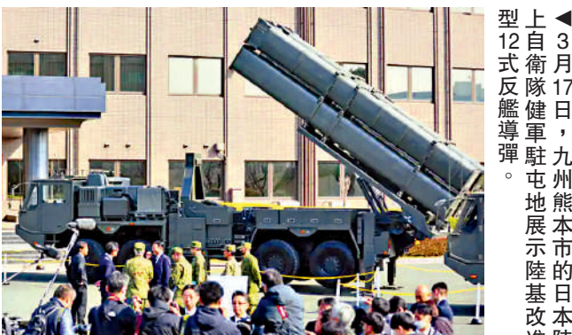
▲3月17日，九州熊本市的日本陸上自衛隊健軍駐屯地展示陸基改進型12式反艦導彈。

據日媒此前報道，日本防衛省計劃3月底前在陸上自衛隊健軍駐屯地部署陸基改進型12式反艦導彈。該導彈射程約1000公里，遠超日本領土範圍。由於該導彈部署後可能增加當地被捲入衝突的風險，這一計劃長期以來在日本國內遭到批評。