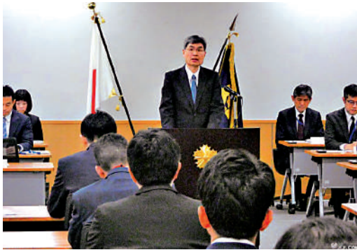
▲日本警察廳長官楠芳伸昨日表示，強闖中國使館案件「不應該發生」且「極為嚴重」。

課堂之外，美化和歪曲侵略戰爭歷史的「靖國史觀」已嚴重滲透到自衛隊內部。以防衛大學為例，其學員通常要經歷長途跋涉的「夜行軍」前往「供奉」有14名甲級戰犯的靖國神社，進行所謂「鍛煉體力氣魄、慰勞護國英靈」的「朝聖」。2024年4月，前海上自衛隊海將大塚海夫出任靖國神社第十四代宮司，成為靖國神社歷史上首個由退役