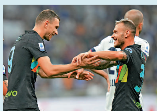
▲迪斯高（左）與迪馬高曾在國際米蘭成為隊友。