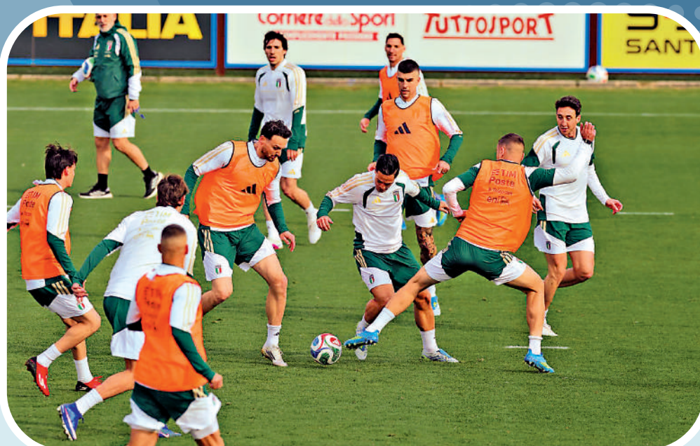
▲意大利球員在賽前積極備戰。