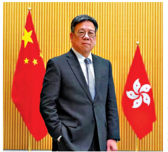
商經局局長丘應樺指出，經濟發展與國家安全有相輔相成作用。