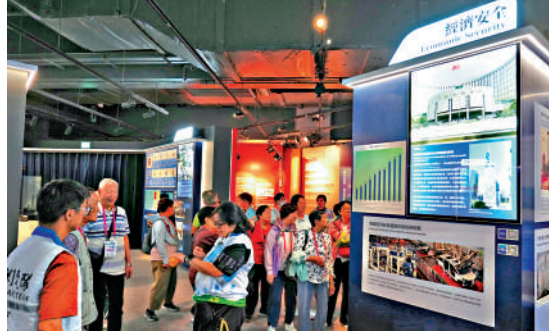
國家安全教育從基礎做起，讓市民對國家安全有具體而全面的認識。

在「更好融入國家發展大局」的大方向下，丘應樺表明該局會致力把更多外地企業引進香港，利用香港的平台進入大灣區，推動大灣區整體發展，並為國家整體經濟以及國際網絡的拓展提供支持。這些都是商經局未來工作的重點範疇。