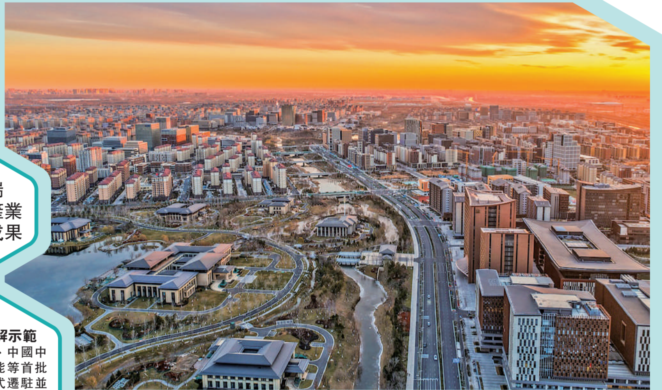
▲河北雄安新區正在成為新時代的創新高地和創業熱土，樹立高端產業新標桿。圖為雄安新區容東片區。