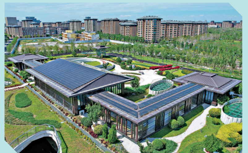
▲河北雄安新區「智慧能源立方」——劇村300千伏變電站外景。

據了解，雄安科創中心中試基地、中關村科技園等高質量運營發展，33棟主題樓宇簽約企業767家，努力打造產業發展「門對門」，科研創新「上下樓」產業生態，創新驅動成為主引擎。