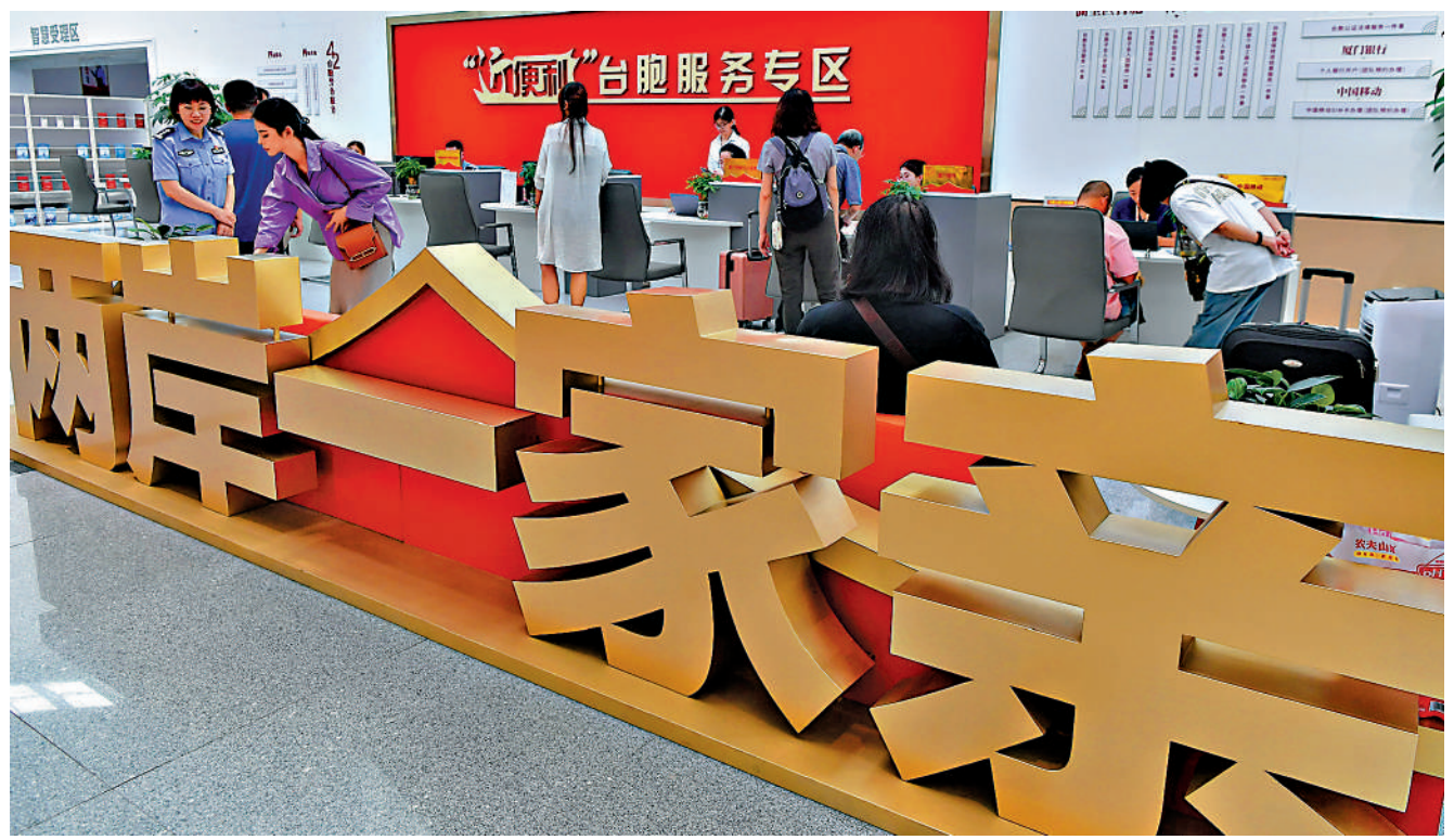
國台辦發言人張哈表示，越早實現統一越有利於台灣發展。圖為台胞在廈門市赴金旅旅遊服務中心「近便利」台胞服務專區辦理業務。

治，終身追責，絕不寬貸。「祖國大陸是廣大陸配的娘家，我們十分關心陸配群體在島內的生活和處境。風雨來時，我們於情於理都要為他們遮風避雨。」此外，台灣電影《陽光女子合唱團》將進軍大陸市場，製片商在社群媒體標寫「中國台灣地區」卻在島內引發爭議。 張哈表示，台灣是中國不可分割的一部分，中國台灣地區是符合一個中國原則的規範表述，相關電影業者的標註反映了客觀事實正常合理，無可指摘。台灣電影進軍大陸市場是分享大陸廣闊市場機遇，實現兩岸影視業互利共贏的好事。