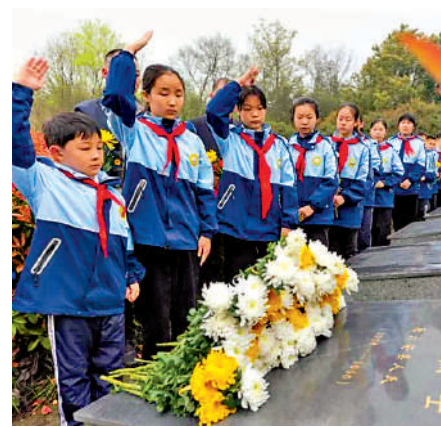
▲在安徽省六安市，學生們向陳琳烈士墓獻花致敬。

今年2月7日，在兩岸多方力量的共同努力下，劉德文帶著林祥燾烈士的骨灰，從台灣啟程，踏上前往福州的歸途。飛機落地的那一刻，漂泊74年的忠魂終於找到了歸宿，這趟跨越74年的「回家」路終於抵達終點。