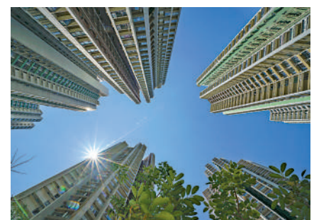
▲美銀指出，近期股市波動，發展商或會對上調售價採取較審慎態度。

美銀指出，在中東緊張局勢下，本地發展商3月份繼續加價推出新盤。由於股票市場與樓價存在較高相關性，而近期股市波動，發展商或會對