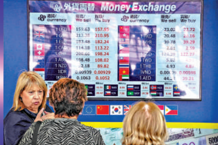
▲投資者關注匯率風險，對以港元計價的投資需求日益增加。

獨立財富顧問及投資平台智安投(Endowus)公布，首次面向香港零售客戶推出三隻貝萊德iShares安碩港元指數基金。這些基金股份類別，以往主要只提供給機構投資者及專業投資者。此次推出的基金，包括iShares安碩環球股票指數基金、iShares安碩環球政府債券指數基金，以及iShares安碩香港股票指數基金。所有基金均以港元計價。