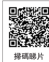
大公報記者 顏 現(文、圖)

隨着 Art Basel 和 Art Central 的結束，藝術三月圓滿落幕，但中環海濱仍洋溢着藝術氛圍。Central Yards 中環藝嘗展在中環海濱呈現長達11天的融合藝術、味覺與想像的多感官體驗。作為香港首創的沉浸式食藝體驗，展覽設有十個風格獨特且充滿玩味的主題展廳，每個展廳均以標誌性藝術流派為靈感，並搭配精緻的創意美食，令參觀者以「美味」為主題體驗藝術創作的魅力。