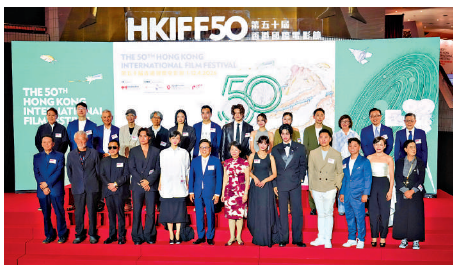
主禮嘉賓出席第50屆香港國際電影節開幕典禮。

「男神」梅塔文、歐帕西安卡瓊現身時，現場近百粉絲報以熱烈歡呼聲。另一位「敢想未來」大使王淨以露背晚裝出席。