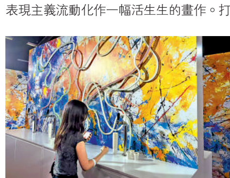
▲「視覺饗宴」展廳中可見達利超現實藝術的影子。

進入「隨心所欲」展廳，視野也明亮起來。展廳糅合色彩、光影與幾何元素，以現代主義風格呈現層層疊疊的七彩風味絲帶。「滴畫」展廳則將大膽奔放的抽象表現主義流動化作一幅活生生的畫作。打