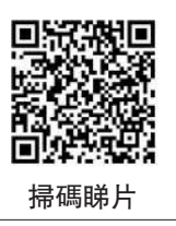
大公報記者 文霏霏(文)

第50屆香港國際電影節昨晚於香港文化中心開幕，為一連12天的電影節打響頭炮。開幕電影為新加坡導演陳哲藝執導的《我們不是陌生人》，並作亞洲首映。今屆電影節選映來自71個國家及地區的逾215部佳作，包括11部世界首映、4部國際首映及49部亞洲首映。超過320場放映中，觀眾更可與多位國際知名電影人交流，包括焦點影人賈樟柯，法國影后茱麗葉庇洛仙；以及陳凱歌、田壯壯、黃建新、許鞍華、蔡明亮、伊迪高安怡迪、陳哲藝、彭力雲坦拿域安、Edwin以及班利華士等一眾著名導演。