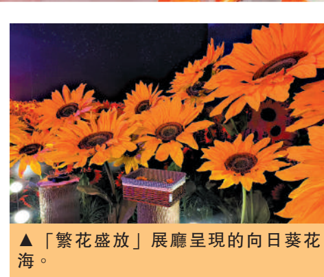
▲「繁花盛放」展廳呈現的向日葵花海。