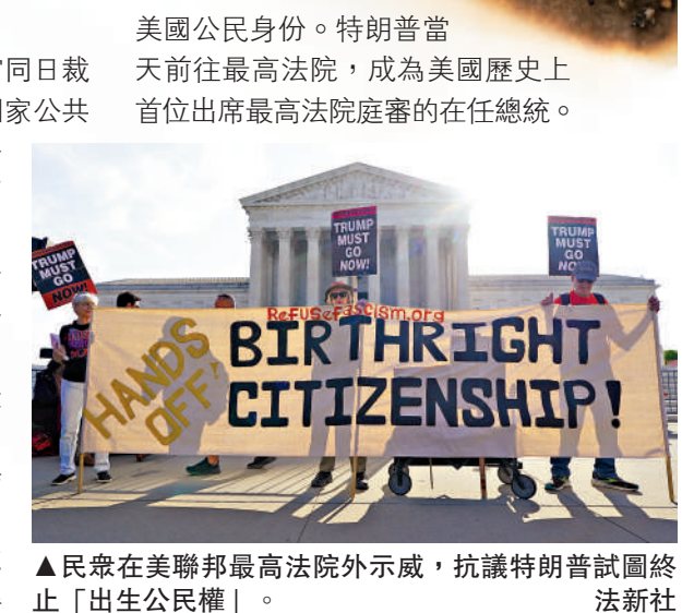
▲民眾在美聯邦最高法院外示威，抗議特朗普試圖終止「出生公民權」。