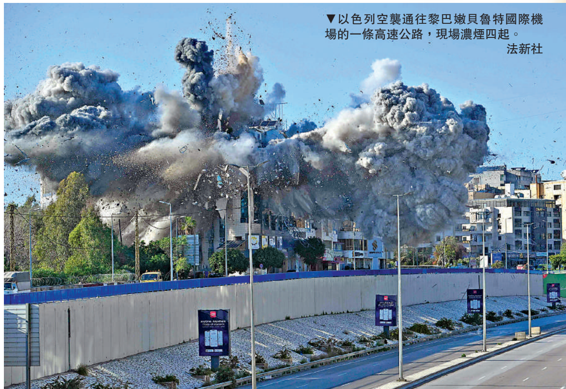
▼以色列空襲通往黎巴嫩貝魯特國際機場的一條高速公路，現場濃煙四起。