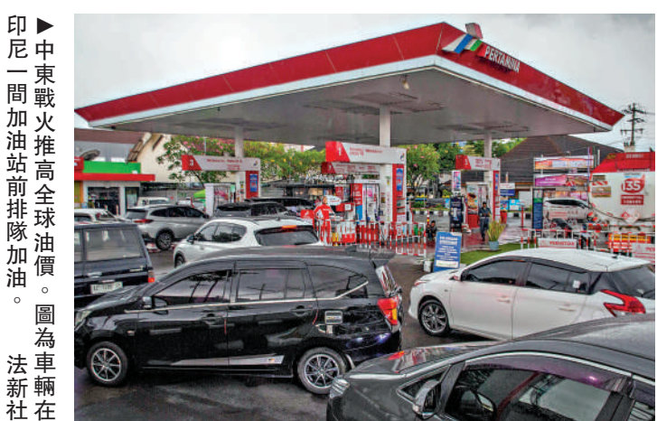
►中東戰火推高全球油價。圖為車輛在印尼一間加油站前排隊加油。圖為車輛在

華盛頓近東政策研究所研究員、曾在五角大樓負責海灣事務的前官員登特認為，海灣國家若參戰，「則需要面對一個更具攻擊性的伊朗，繼續承受關鍵基礎設施的打擊以及投資者信心的潛在流失，然後艱難地試圖重建與鄰國的關係」。