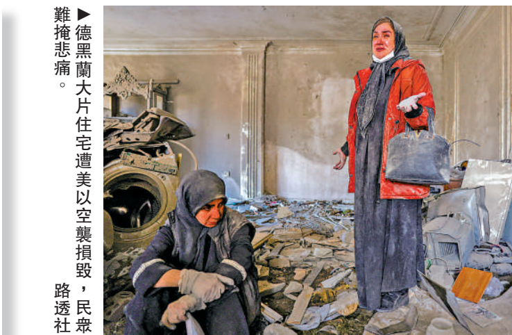
►德黑蘭大片住宅遭美以空襲摧毀，民衆難掩悲痛。