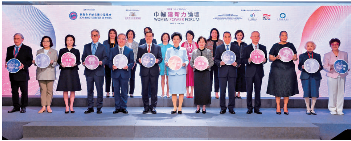
▲第四屆中樞建新力論壇昨日舉行，嘉賓在台上合照。

黃曉薇強調，推進婦女事業發展是國際社會的共同責任。她亦肯定香港在婦女事業上的努力，表示行政長官李家超帶領特區政府營造了平等包容的發展環境，例如局長及常任秘書長中有一半以上是女性，形容在中國婦女事業發展中，香港綻放獨特的時代風采。