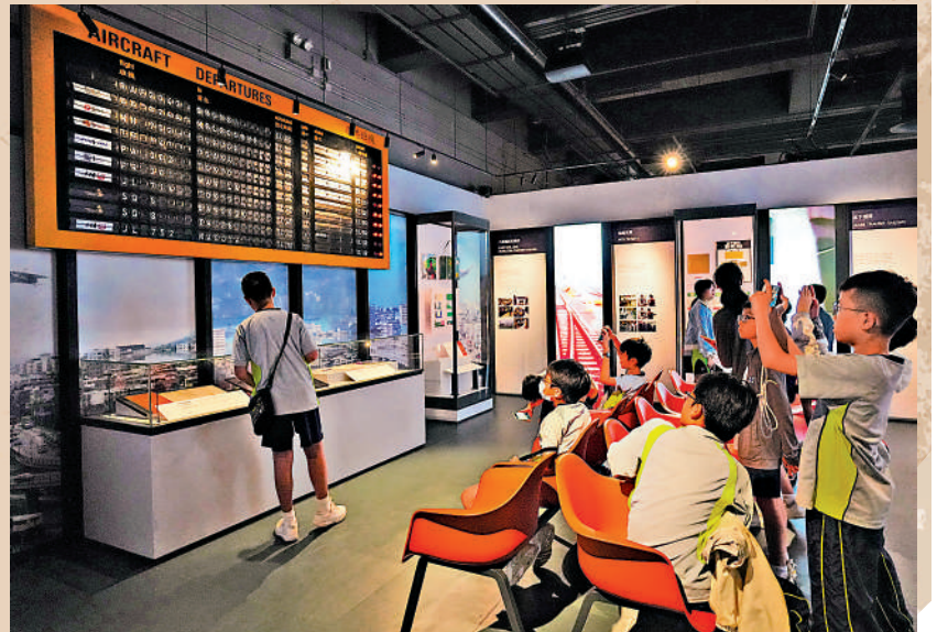
◀展覽展出日本1945年投降時呈交的佩刀，是最受注目的展品之一。