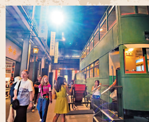
▲「華洋融合」展區有雙層電車、唐樓街景等，重現1930年代的大街風貌。

隨着二十世紀末城市更新與中藥店面臨遷拆，誠濟堂的歷史價值愈顯珍貴。本次展覽將整座中藥店的舖面與內部陳列完整保存，並忠實復原當年原貌，使觀眾得以身臨其境，感受香港傳統藥業的風采與文化底蘊。