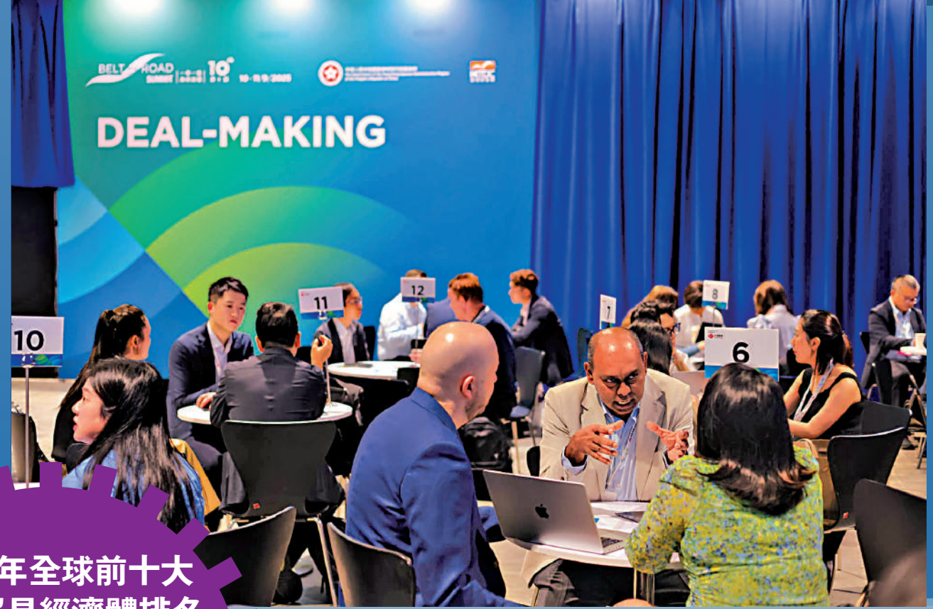
2025年全球前十大商品貿易經濟體排名 (億美元)