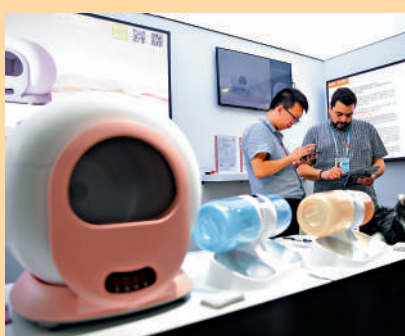
▲受AI相關產品需求帶動，去年全球商品貿易量增長勝預期。

報告表示，戰事阻礙石油運輸，推高油價，或重創今年貨物貿易。中東亦是交通與旅行樞紐，運輸及旅遊中斷將打擊服務貿易。美國總統特朗普揚言，伊朗戰爭未來數周升級。布蘭特期油周四急升逾8%至109美元，紐約期油升近13%至113美元。瑞銀估計，若霍爾木茲海峽推遲至5月或6月重開，油價將維持100至150美元，若推遲至11月，或突破170美元。