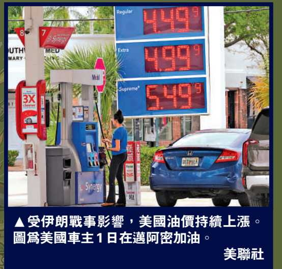
▲受伊朗戰事影響，美國油價持續上漲。圖為美國車主1日在邁阿密加油。