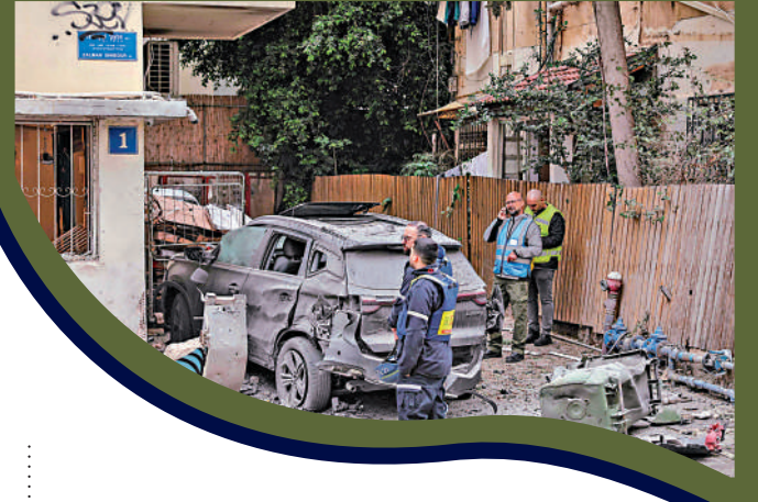
▼以色列特拉維夫1日遭空襲，安全部隊人員趕到現場。