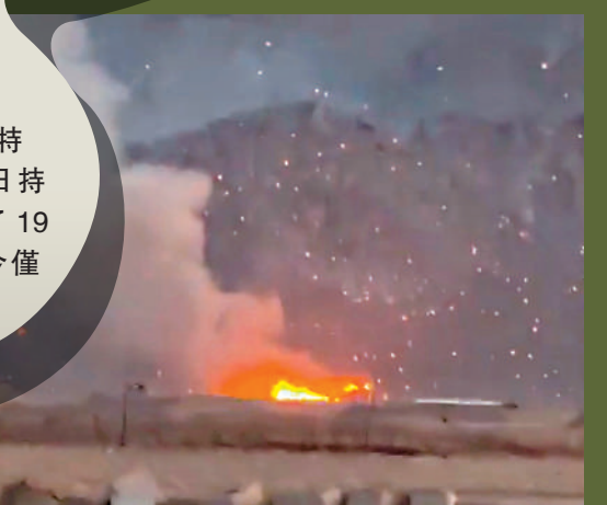
▼社交媒體上的視頻顯示，伊朗伊斯法罕地區1日遭美以空襲。

另據美媒報道，美軍已經制定了一個派遣特種部隊奪取伊朗伊斯法罕濃縮鈾庫存的方案，包括在伊朗炮火下空投挖掘設備、在伊朗境內修建跑道和前沿基地，並使用貨運飛機將放射性物質運出。有分析指出，這一作戰行動風險極大，還可能導致核材料洩漏。