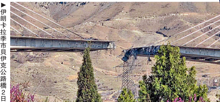
遭美以襲擊受損。伊朗卡拉季市貝伊克公路橋2日網絡圖片