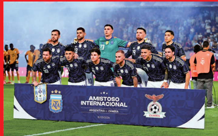
▲阿根廷的FIFA世界排名亦微跌1級至第3位。