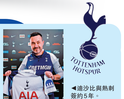
▲迪沙比與熱刺簽約5年。

【大公報訊】英超熱刺3月31日宣布，46歲的意大利籍教頭迪沙比接任成為球隊新主帥，據報雙方簽下長達5年的合約，年薪高達1500萬英鎊。迪沙比上任後首先要提升熱刺排名爭取護級成功，對於會方今次聘任，熱刺名宿荷杜特別質疑開出合約年份過長，因為對方從未長留在一支球隊執教。