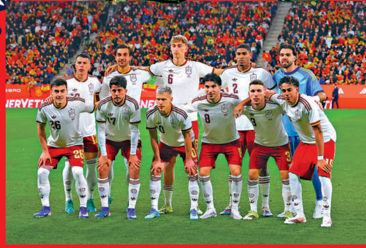
▲西班牙在FIFA世界排名退居第2位。