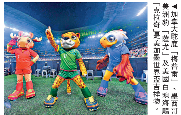
▲加拿大駝鹿「梅普爾」、墨西哥美洲豹「薩尤」及美國白頭海鷗「克拉奇」是美加墨世界盃吉祥物。

美加墨世界盃將於6月11日至7月19日在美國、加拿大、墨西哥的16座城市舉行，這是首次有48支球隊參賽的世界盃，比賽場次也大幅增加至104場。